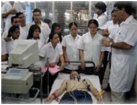
Laboratorio de la ELAM

La ELAM ha tenido ya 9 promociones (que concluyeron el programa de seis años) con 20 786 profesionales de la salud, procedentes de 74 países.