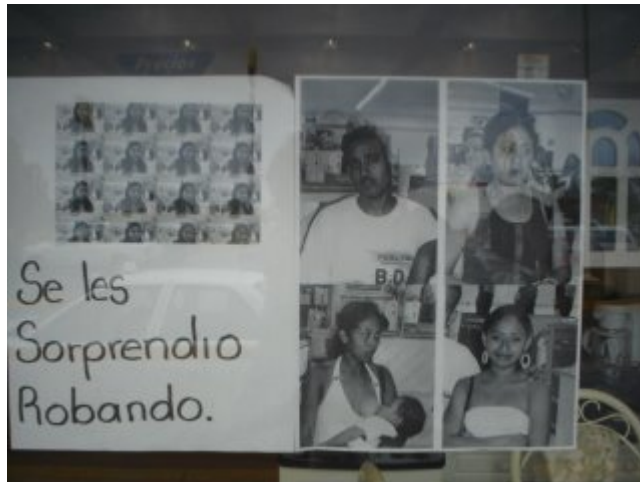
Chula estampa que hasta posa la de la esquina