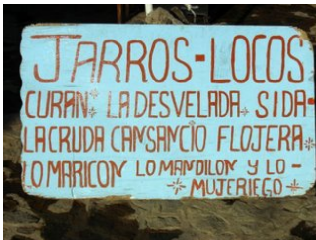
A quien corresponda...hay pa' todos....