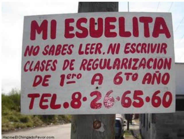
Llo, ayi me estoi titulando