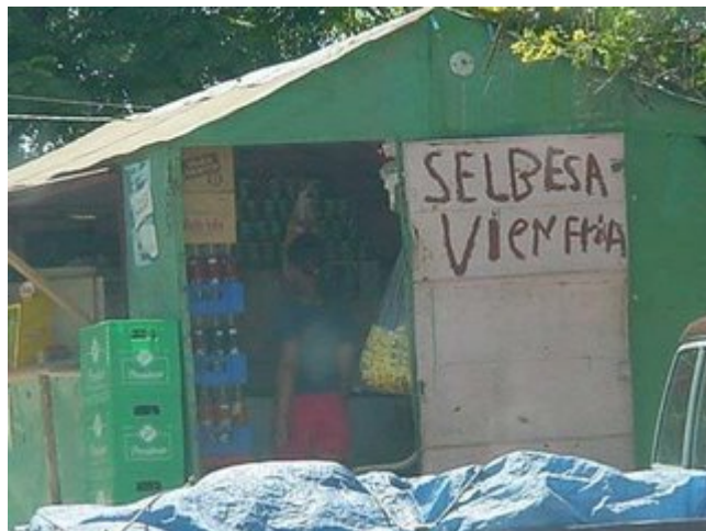
¿Qué puedo decir de esto? Simplemente, hermoso... le falto atentamente Niurka