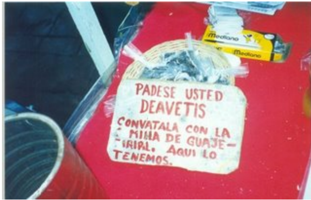
Otro sin comentarios