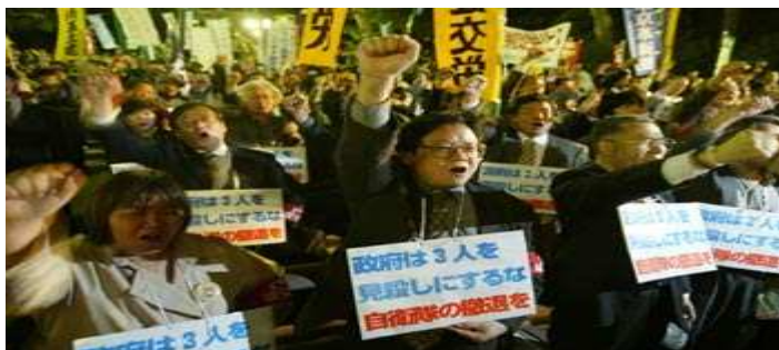
Manifestaciones en Tokio a favor del retiro de las tropas japonesas de Iraq, el 9 de abril. Las protestas se producen luego que tres connacionales fueran secuestrados por insurgentes en el país árabe.