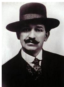
Enrique Gómez Carrillo 1873-1927