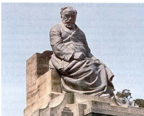
Monumento a Lorenzo Montúfar Obra del escultor Rafael Rodríguez Padilla, 1923

“El infrascrito Ministro Plenipotenciario de las repúblicas de Guatemala y El Salvador tiene la honra de manifestar al Excelentísimo Señor Secretario de Relaciones Exteriores de los Estados Unidos que habiéndose publicado el reconocimiento hecho por este gobierno del que ha pretendido establecer en Nicaragua el ciudadano de estos Estados, Mr. Walker, se ve en la imperiosa necesidad de protestar contra este acto, teniéndole por el más contrario y ofensivo a los intereses de Centro-América.” 11