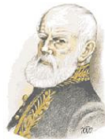
Antonio José de Irisarri

(1786-1868), fallecido en Nueva York mientras ocupaba el cargo de Embajador de Guatemala ante el Gobierno de los Estados Unidos, repatriados al país en 1968, y del poeta Domingo Estrada (1809-1901), cuyo deceso ocurrió en París siendo a la sazón Secretario de la Embajada de Guatemala en Francia. “Locura de gobernante: ante la imposibilidad de repatriarlo colocaron una placa simbólica con el nombre de Enrique Gómez Carrillo -1879-1927-. 3 Poco dura una gloria mal cuidada: todas las letras de bronce han sido arrancadas, las placas de pizarra están atestadas de ‘grafittis’ y el sitio es un muladar, apenas queda la silueta de los nombres.” (Pág. 23).