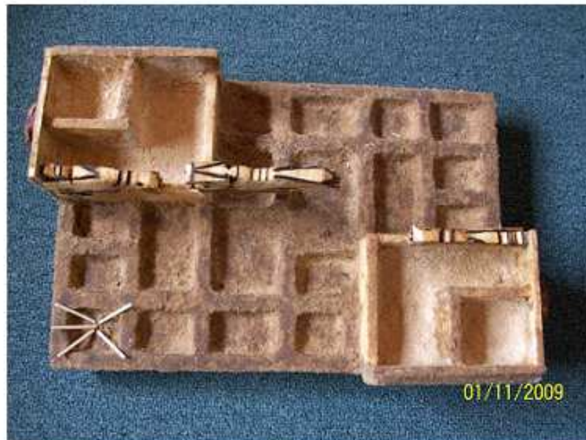
YUPANA MODELO ARTÍSTICO Y DE ESTUDIO Materiales: maderas recicladas Autor Rubén CALVINO