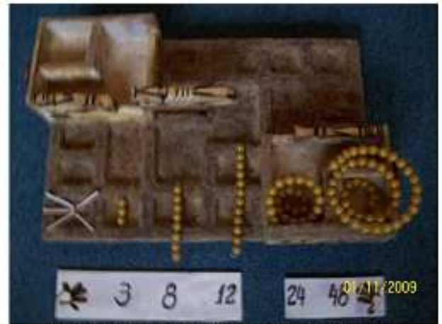
Valor numérico de casillero en terminos de manos