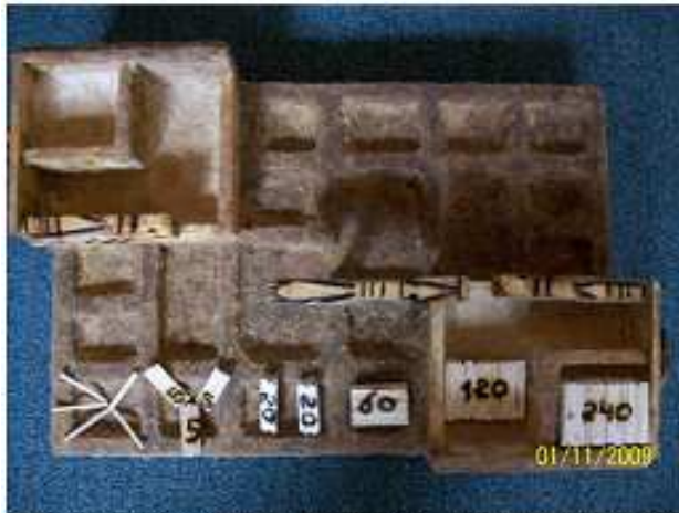
Cantidad de piezas numéricas por casillero y sus valores unitarios

<lo ulterior se transforma en fundamento de lo anterior>- SAMAJA -Dialéctica de la investigación científica-