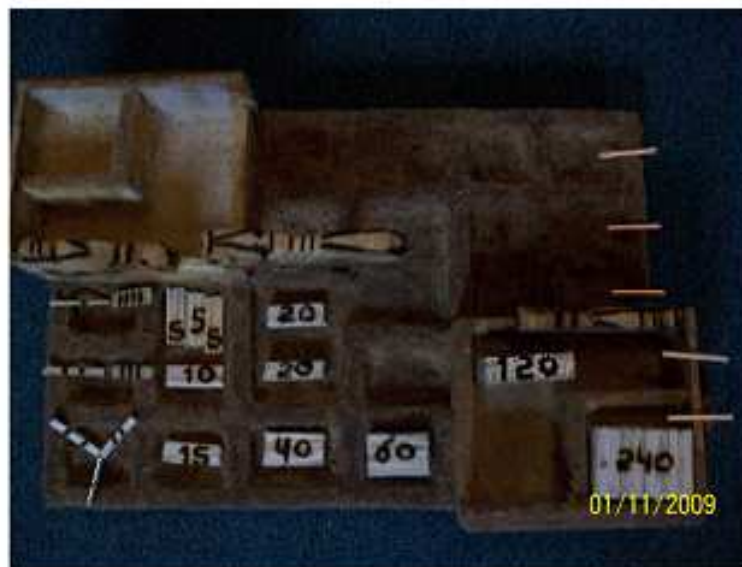
Valor total por casillero y asociatividad de piezas