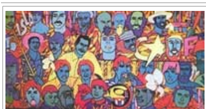
Raúl Martínez. Isla 70 , 1970, óleo/tela; 200 x 243 cm. (Museo Nacional de Bellas Artes, La Habana, Cuba).

Por su parte Raúl Martínez desarrolla una línea de experimentación visual a partir de los logros del pop-art, creando una nueva iconografía que consolida la imagen de la Revolución, sus héroes y la vida cotidiana bajo el proceso "revolucionario". El interés por los temas sociales se aprecia en muchas de sus obras: esquemáticas figuras siempre expectantes que viven bajo el proceso "revolucionario", o en la desmitificación que hace de políticos y héroes nacionales. Isla 70 (1970) es su obra antológica. Dentro de esta misma línea de iconización de las nuevas creaciones sociales de la Revolución, se destaca la obra de Servando Cabrera con la representación de sus milicianos; discurso que finalmente evoluciona hacia el exaltado erotismo de sus imágenes.