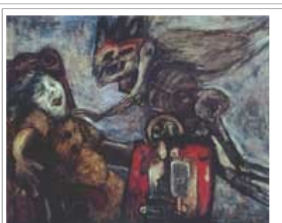
Antonia Eiriz. La anunciación , 1962, óleo/tela; 190,5 x 243 cm. (Museo Nacional de Bellas Artes, La Habana, Cuba).

Muy contrario al optimismo de los primeros años "revolucionarios", la obra de Antonia Eiriz se desarrolla dentro de las claves de un expresionismo figurativo muy grotesco, que no se aviene con la línea ideológica que entonces predominaba. Sus pinturas y esculturas-instalaciones parecen ir a contracorriente: son la materialización del dolor, del drama y de la tragedia. Destaca de su producción el cuadro La anunciación (1962), obra entendida como premonitoria de la actual situación cubana.