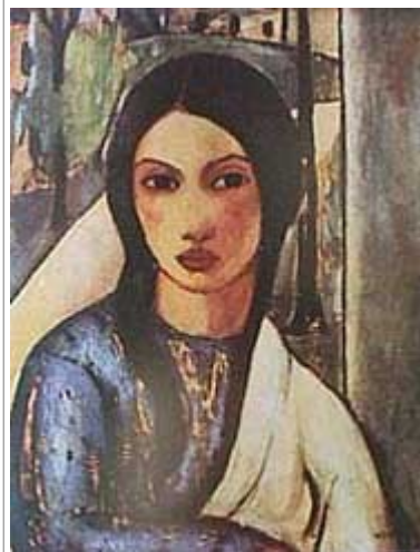
Víctor Manuel. Gitana tropical , 1929, óleo/tela; 46,5 x 38 cm. (Museo Nacional de Cuba, La Habana).

La primera generación de pintores modernos busca la realidad cubana en sus paisajes, costumbres y personajes. Pintores como Víctor Manuel, Carlos Enríquez, Eduardo Abela, Jorge Arche, Arístides Fernández, Rafael Blanco, Jaime Valls, Antonio Gattorno, Leonardo Romero Arciaga, Fidelio Ponce, Domingo Ravenet... iniciarán su labor de pioneros, al asimilar el instrumental de las vanguardias europeas postimpresionistas, con el fin de buscar una nueva manera de expresar determinadas realidades del país. Comenzó entonces el estudio de la rica herencia africana y de los aportes de la cultura popular campesina.