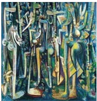
Wifredo Lam. La jungla , 1943, óleo/papel reforzado; 239,4 x 230 cm. (Museo de Arte Moderno, Nueva York).

Ya en la primera mitad de la década del cuarenta, la plástica cubana está en una etapa de afirmación de valores temáticos y formales. La herencia afrocubana, con Wifredo Lam, encuentra un reconocimiento definitivo, ya no es sólo la representación del negro como raza, ahora se legitiman, a través del arte, las creencias, los elementos simbólicos de la cultura que funcionan a niveles más complejos: personajes, sucesos y formas oníricos del pensamiento mágico y religioso de la gente, encuentran un reconocimiento definitivo. La simbología de Lam es rica en elementos zoomorfos imbricados, a veces, en una copiosa vegetación a la manera de La jungla (1943). Es la simbiosis entre el monte y las deidades afrocubanas, lógico remedo de un pensamiento mítico-simbólico que entiende el monte como habitad de estos dioses.