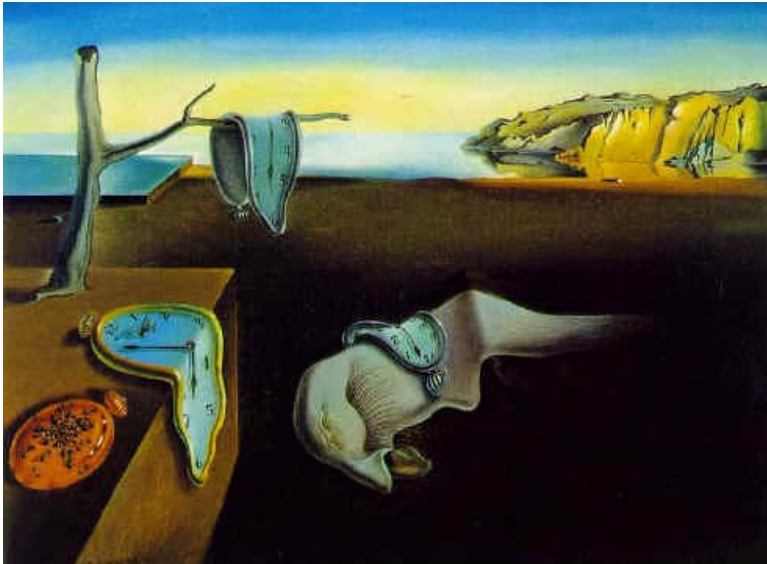
Óleo sobre lienzo. 1931. Dimensiones: 24 x 33 cms. Museo de Arte Moderno de Nueva York.

Estamos delante de un paisaje onírico. Parece una playa al anochecer. En primer término y en posición central, destaca una extraña figura: una cabeza blanda con una enorme nariz, de larga y carnosa lengua que sale de ella, pero carece de boca. Su raro cuello se pierde en la oscuridad. Reposa dormida sobre la arena, ya que vemos cerrado su ojo, con unas enormes pestañas. Puede muy bien ser un autorretrato estilizado del pintor.