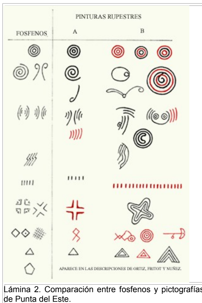
Lámina 2. Comparación entre fosfenos y pictografías de Punta del Este.

De modo que podemos inferir –con temor a equivocarnos, lógicamente- rituales chamánicos en Punta del Este estrechamente vinculados al uso de plantas alucinógenas. Si observamos la tabla que ilustra los fosfenos universales que despejara el físico alemán Max Knoll (16), nos percatamos de la exacta analogía entre muchísimos de estos fosfenos con todas las representaciones ideográficas del arte rupestre de Punta del Este.