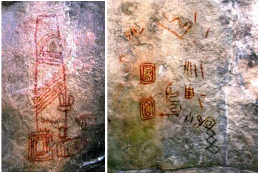
Algunos grupos pictóricos precolombinos de la piedra de Fusca. (Diego Martínez, 1998)

Fotografía y levantamiento de la Piedra de Fusca (Diego Martínez, 1998)