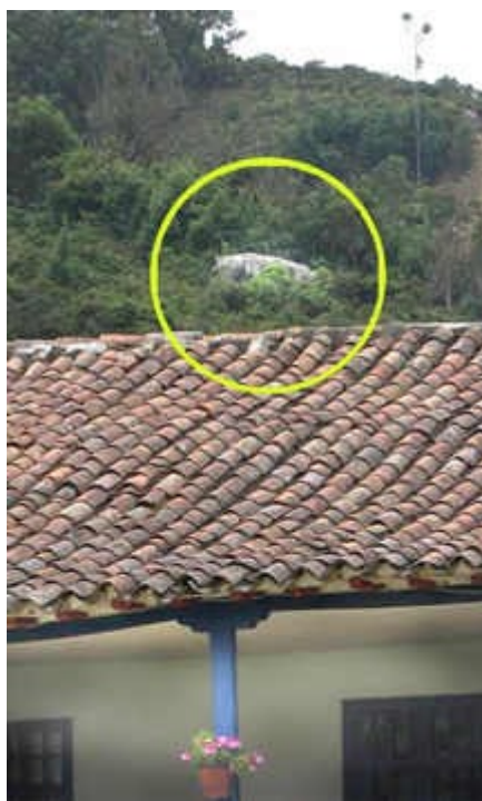
Hoy día la piedra de Fusca sólo puede ser observada a la distancia desde la Hacienda de Fusca. (Diego Martínez, 2006)

Es recurrente que muchos sitios rupestres tengan acceso restringido, y aunque se entiende el respeto por la propiedad privada, no parece haber ningún tipo de instrumento jurídico que permita que estos sitios sean visitados públicamente para su reconocimiento.