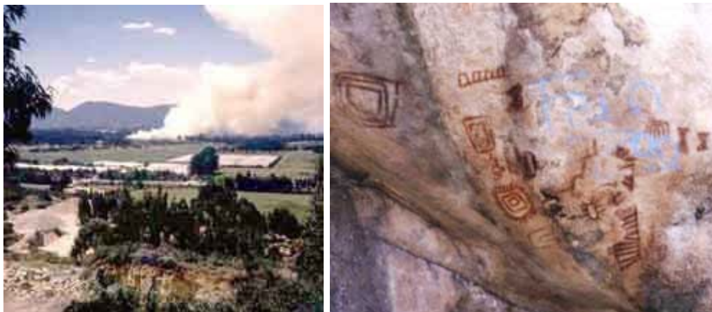
Diversos factores que alteran la conservación de la piedra de Fusca. Explotación minera de calizas (izq.) y vandalismo con graffiti (der.). (Diego Martínez, 1998)

Los sitios de arte rupestre en Colombia se encuentran diseminados por todo el territorio, por lo que es recurrente que se encuentre en predios privados y, sólo en contadas excepciones, en terrenos de la nación o con algún tipo de protección garantizada. Los propietarios de los terrenos donde reposa un sitio rupestre, deben ser conscientes de la importancia de esta manifestación, y deben garantizar su conservación (Ley 397 de 1997, Título II, Artículo 11, numeral 2). También deben entender que el arte rupestre es un bien cultural de todos los colombianos, por lo que deben permitir su visita para labores de investigación (artículo 15, ley 163 de 1959) o visitas de interés cultural y turístico.