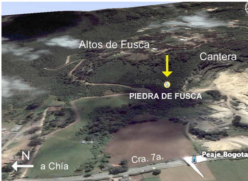
Ubicación de la piedra de Fusca, entre Bogotá y el municipio de Chía.

Con motivo de la celebración del Día Nacional del Patrimonio Cultural , el Programa Siga esta es su casa -Rodante del Instituto Distrital de Cultura y Turismo (IDCT) organizó, para el pasado 24 de septiembre de 2006, una visita pública guiada (35 personas aprox.) a la Piedra de Fusca en el municipio de Chía, a tan sólo 15 minutos del casco urbano de Bogotá. Infortunadamente esta iniciativa no pudo llevarse a cabo debido a que el propietario del terreno se negó a permitir su acceso.