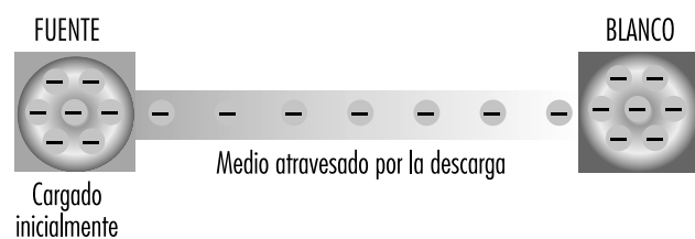
Figura 40.2 • Dibujo esquemático del problema de la descarga electrostática.

Es esencial que el equipo sea instalado y mantenido por personal cualificado. Se debe subrayar que es preciso establecer medidas técnicas que garanticen el funcionamiento