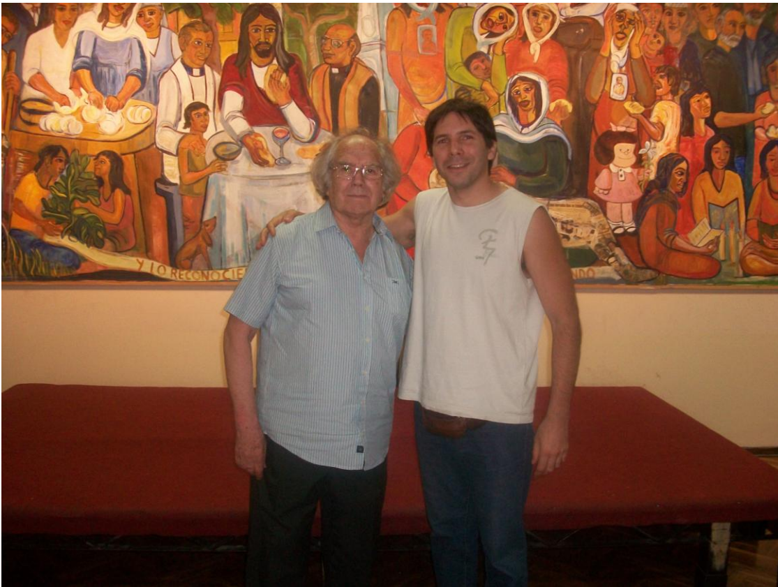
Adolfo Pérez Esquivel.