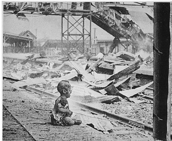
Guerra civil española, Guerra contra El Líbano y Batalla de Shanghái.

Yo he vivido equivocado casi toda mi vida, por eso doy estos consejos: porque quiero que nadie más se equivoque. Y, además, dejo una obra cuyo contenido no viene al caso pero que me encargué de divulgarla a gente a quienes les fue útil, así que si un día cruzo la calle y me pisa un auto, mi estadía en la Tierra no fue en vano.