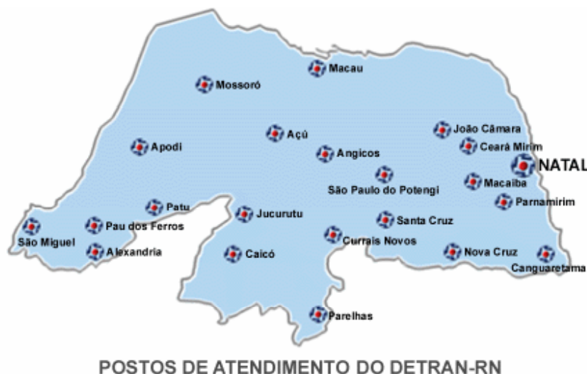
Figura 2 - Representações do DETRAN-RN no estado

O DETRAN-RN possui representações (CIRETRANS) em quase todo o interior do estado (Figura 2): Mossoró, Macau, Apodi, Açu, Angicos, João Câmara, Ceará Mirim, São Paulo do Potengi, Macaíba, São Miguel, Pau dos Ferros, Patu, Jucurutu, Currais Novos, Santa Cruz, Parnamirim, Alexandria, Caicó, Nova Cruz, Canguaretama e Parelhas, como mostra a figura a seguir.