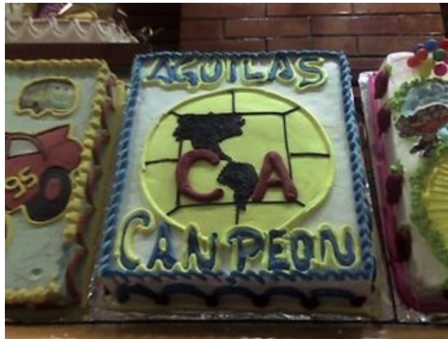
No niegan la cruz de su parroquia verdad ....(¿canpeon?)