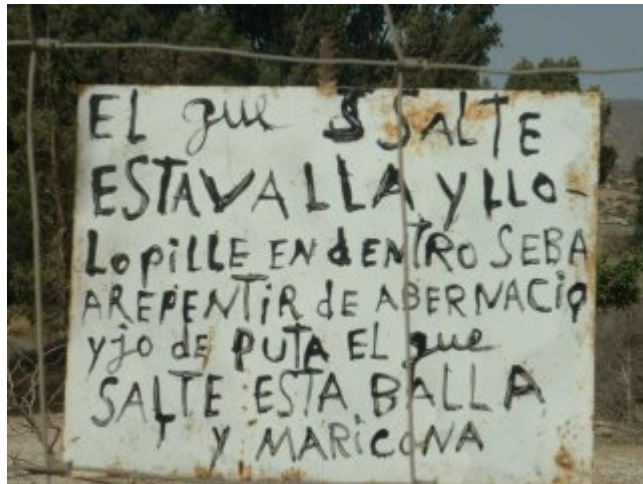
Así o más claro? chale...