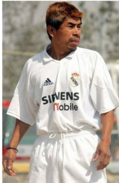
La nueva estrella del Madrid