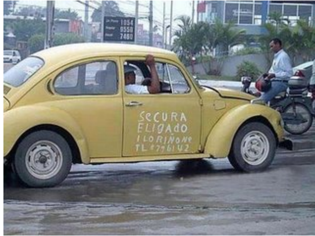
Curanderos a domicilio