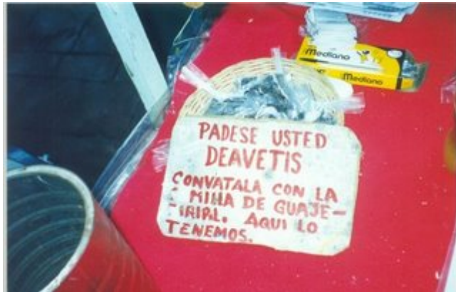
Otro sin comentarios