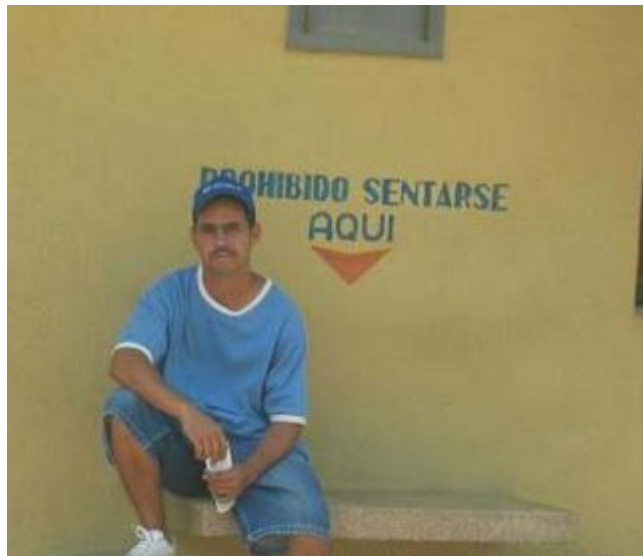
Es un chico RBD