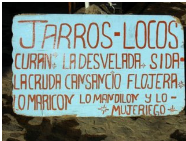
A quien corresponda...hay pa' todos....