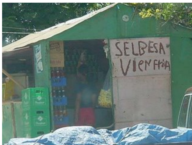
¿Qué puedo decir de esto? Simplemente, hermoso... le falto atentamente Niurka