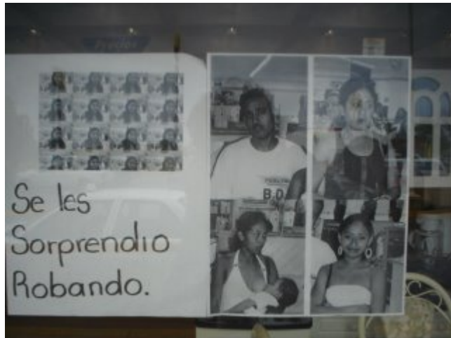
Chula estampa que hasta posa la de la esquina