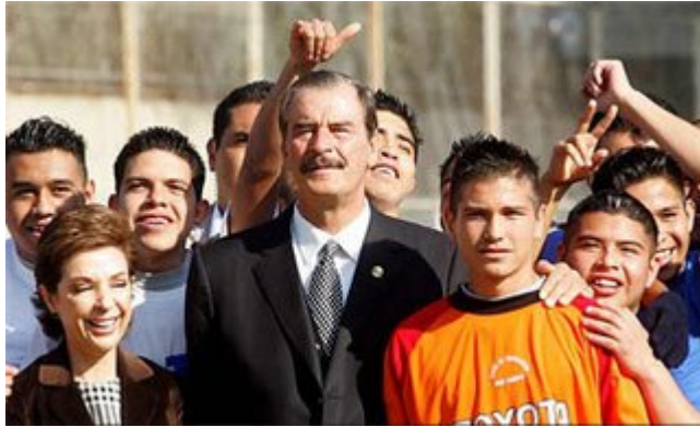
Acá esta Chente el que escribió lo de arriba...