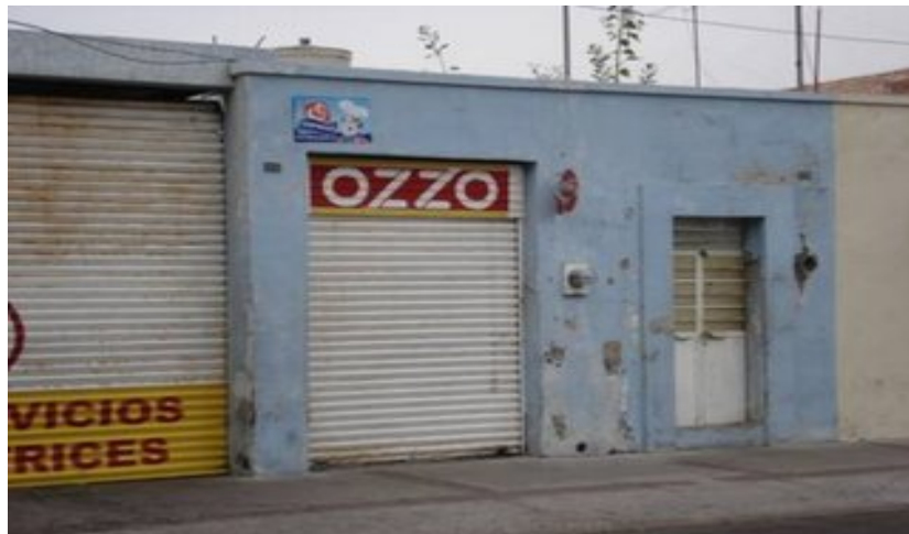
A chirrión, ahí venden cerveza Zol e Yndyo ja