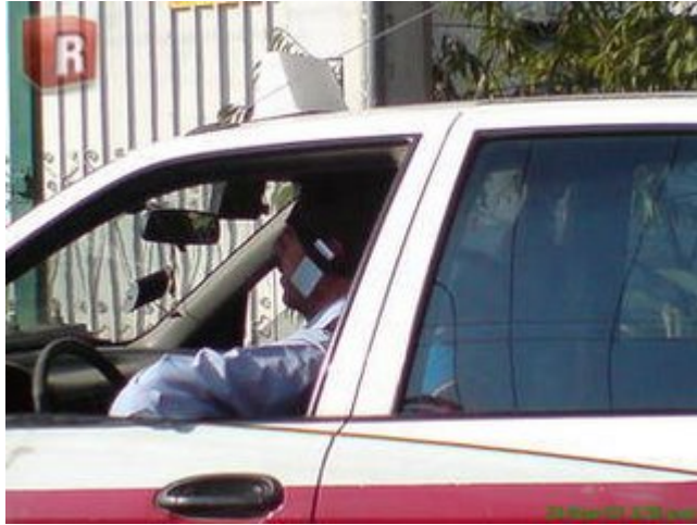
Ese es manos libres patente mexicana