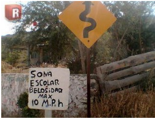
Por aí ezta el teknolojico