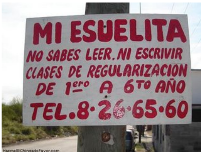
Llo, ayi me estoi titulando