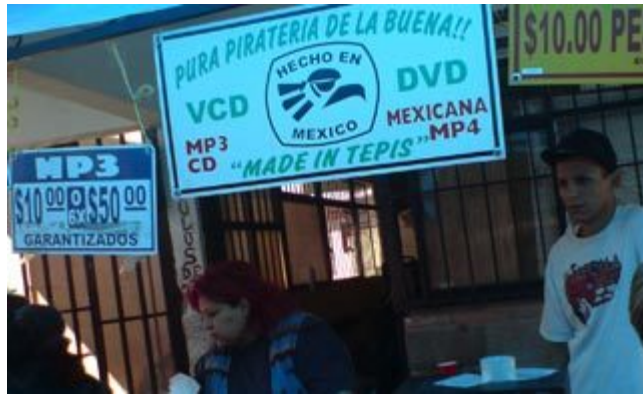
pura calidá diría Tachito... mejores que los chinos...