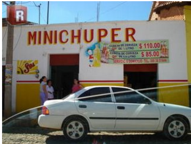
Sepa la chin.. que venderán ahí