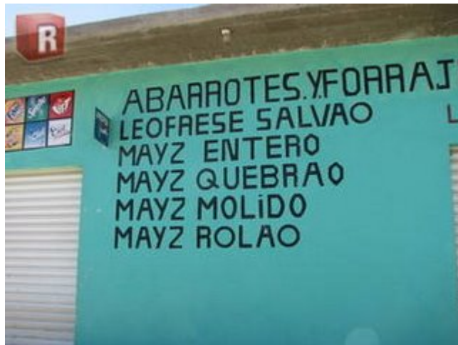
Puro producto básyco