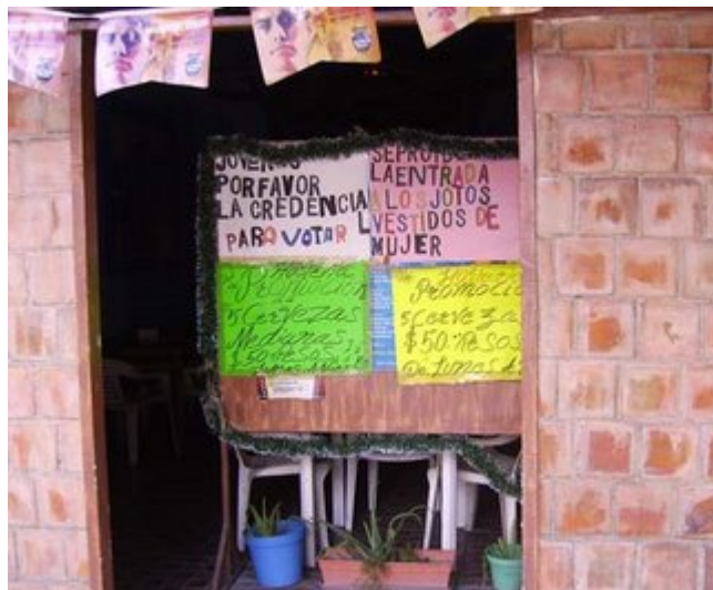
Eso es homofobia o ¿¿no??