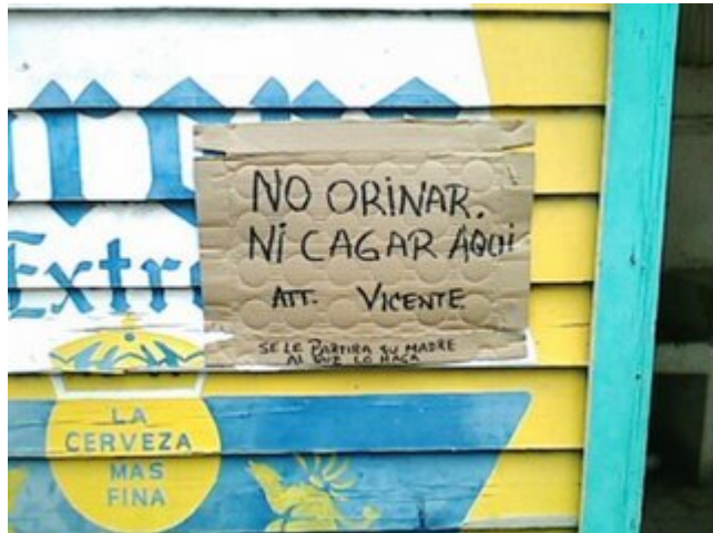
Ni pedo, ya dijo Chente (lean las letras chiquitas)