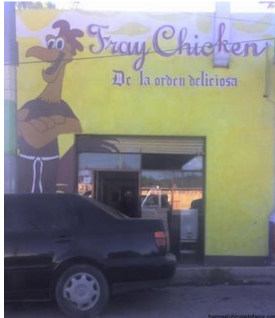
Versión mexicana de la tarea de Planeación Estratégica