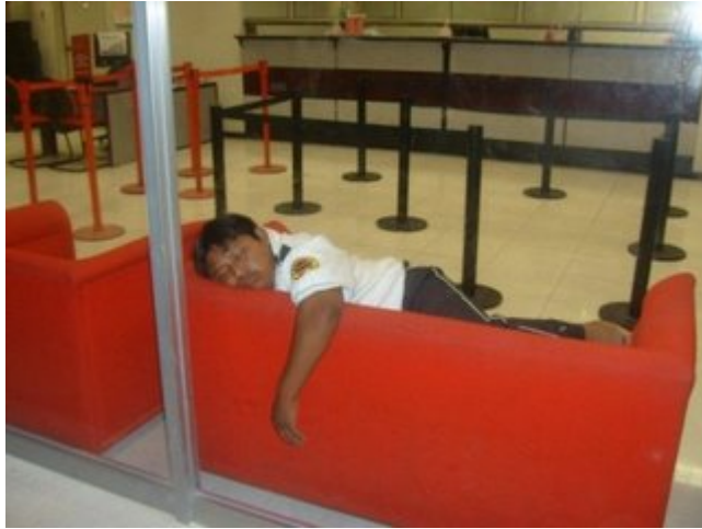
La policía siempre en vigilia... creo que es de BANORTE