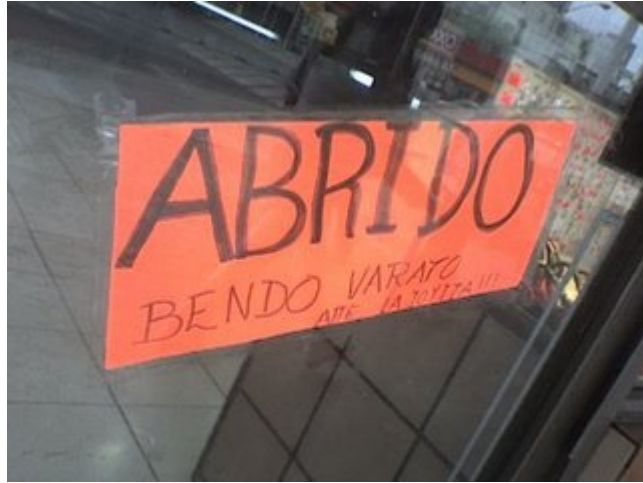
Una mentada al idioma