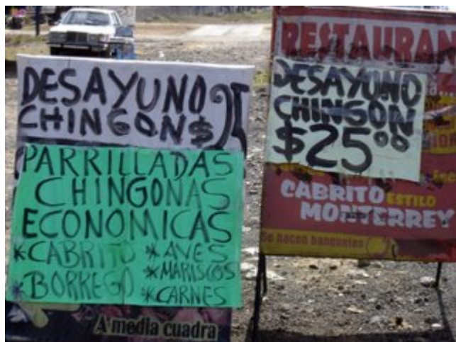
No, pues me quedó claro