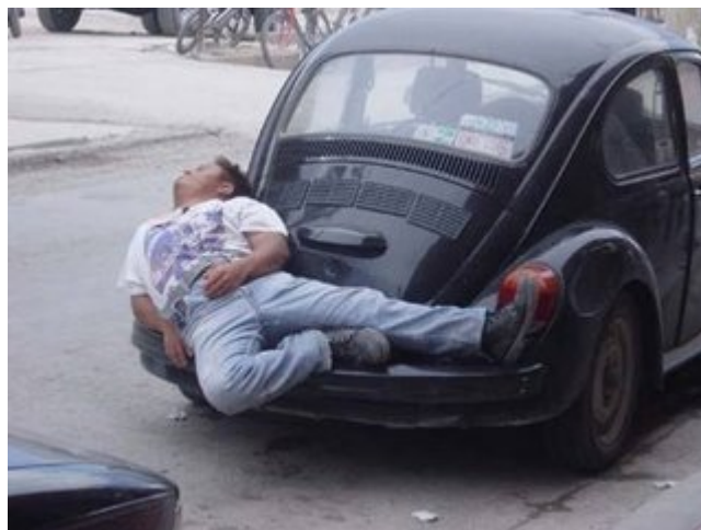
¿Qué hubo ? un coyotito nunca cae mal