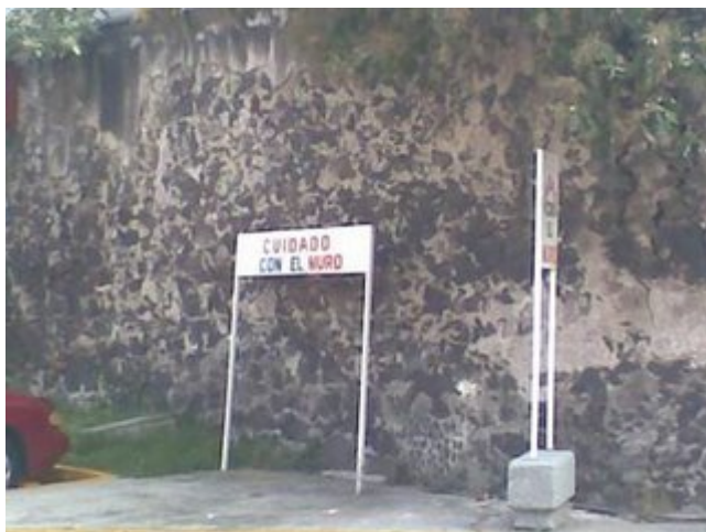
¿Cuál? No manches, si ni se ve