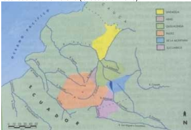
Fig. 3 Mapa de ubicación de los Pastos en el sur de Colombia, según Doumer Mamian.

La población tenía sus asentamientos, tanto en el frío altiplano de Túquerres e Ipiales como en el profundo valle del río Guáytara, aprovechando zonas de clima templado. Restos de esta fase de desarrollo se han encontrado en regiones que según los datos históricos del siglo XVI, no eran asientos de indígenas Pasto. Se trata de la margen oriental del río Guáytara hacia el altiplano de Pasto y por el Norte hasta cerca de la localidad de Villamoreno (Groot et. al. 1976).