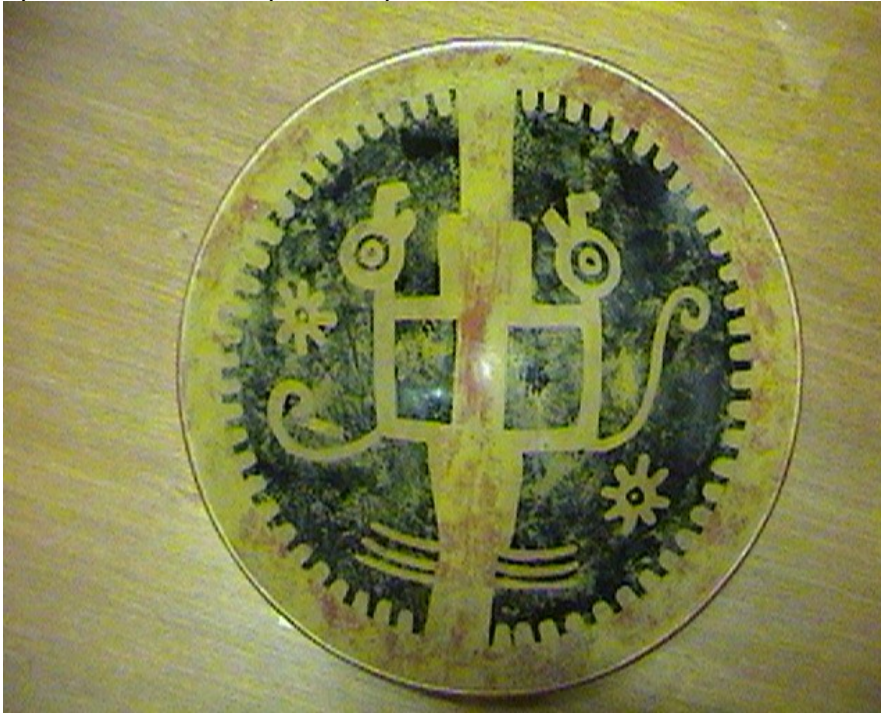
FIG.1 EL PLATO DE LA CREACION COLECCIÓN CONAVI PASTO

Al parecer el lugar donde se tractoraba el terreno había sido seleccionado por los Pastos como cementerio, ya que en cuatro ocasiones tuvimos la misma experiencia de guaquear. En las tumbas siempre encontramos un solo cadáver por hueco, con apariencia de ser importante por lo atuendos de vestir.