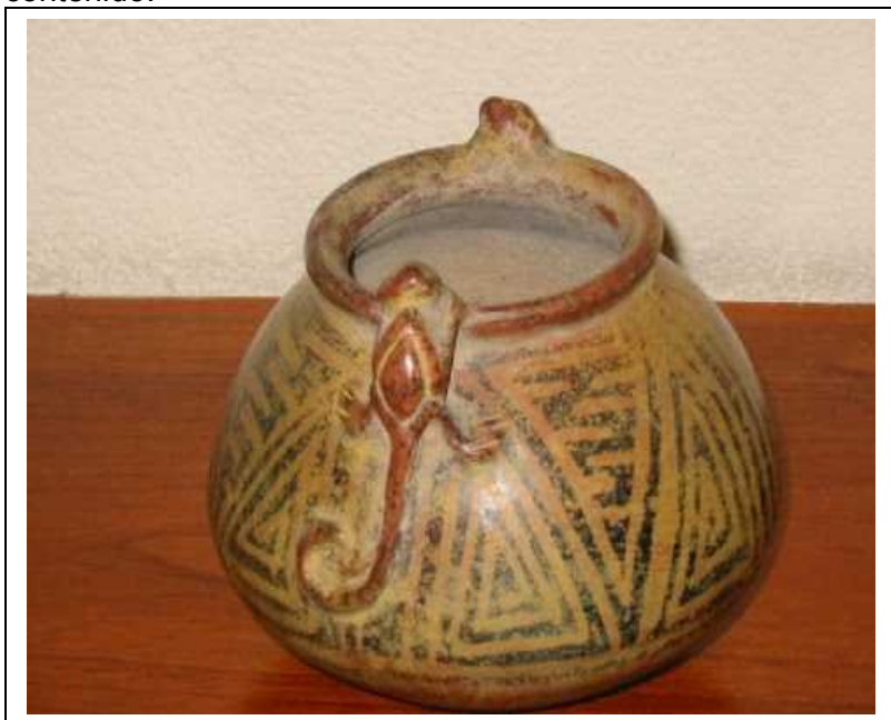
Fig. 18 Vasija de ritual de los Pastos Colección CONAVI. Pasto

Este centro se aparece como un jeroglífico misterioso y mutable. En un principio es como un vórtice, que todo mana y todo devora y al mismo tiempo, cabeza y cola de la serpiente de la eternidad; A cada lado de las figuras aparecen dos triángulos Fig. (7), conformados el primero por la Tetraktis y el segundo por la Nonatraktis, el primero en su conjunto simboliza la unidad y el segundo que representa el 9, los dos unidos representan los diez mandamientos, la Alianza con Jehová, es también el Arca y su contenido.