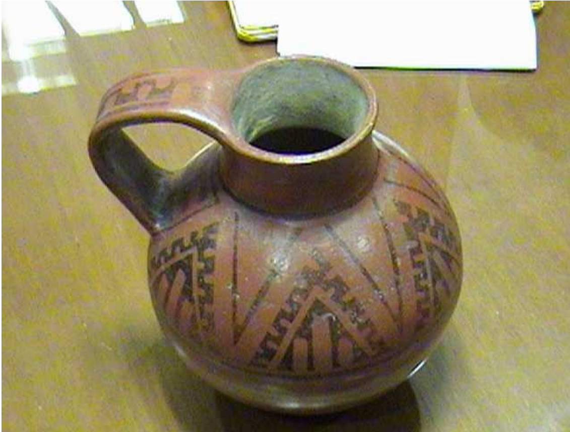
. Fig. 13. Vasiija ceremonial colección CONAVI

Útil para transportar agua energizada, o chicha mascada, con la cual curaban a los enfermos, o producían estados alterados de la psique, su poder estaba en la combinación de formas geométricas que rodeaban la olla. De esta manera las creencias se manifestaban a través del chamanismo, que tiene por misión ayudar a los seres vivos a recuperar el equilibrio perdido. Por lo tanto, podría ser definido como un método de diagnóstico y tratamiento que utiliza las más altas facultades de la mente humana -percepción extra- sensorial-, en conjunción con determinados instrumentos diseñados (las ramas y plumas de los chamanes o curanderos) especialmente para ello, para determinar las causas ocultas de las enfermedades y, en muchas ocasiones, para realizar su tratamiento. Es algo igual a lo que hoy hacen con la Radiónica.