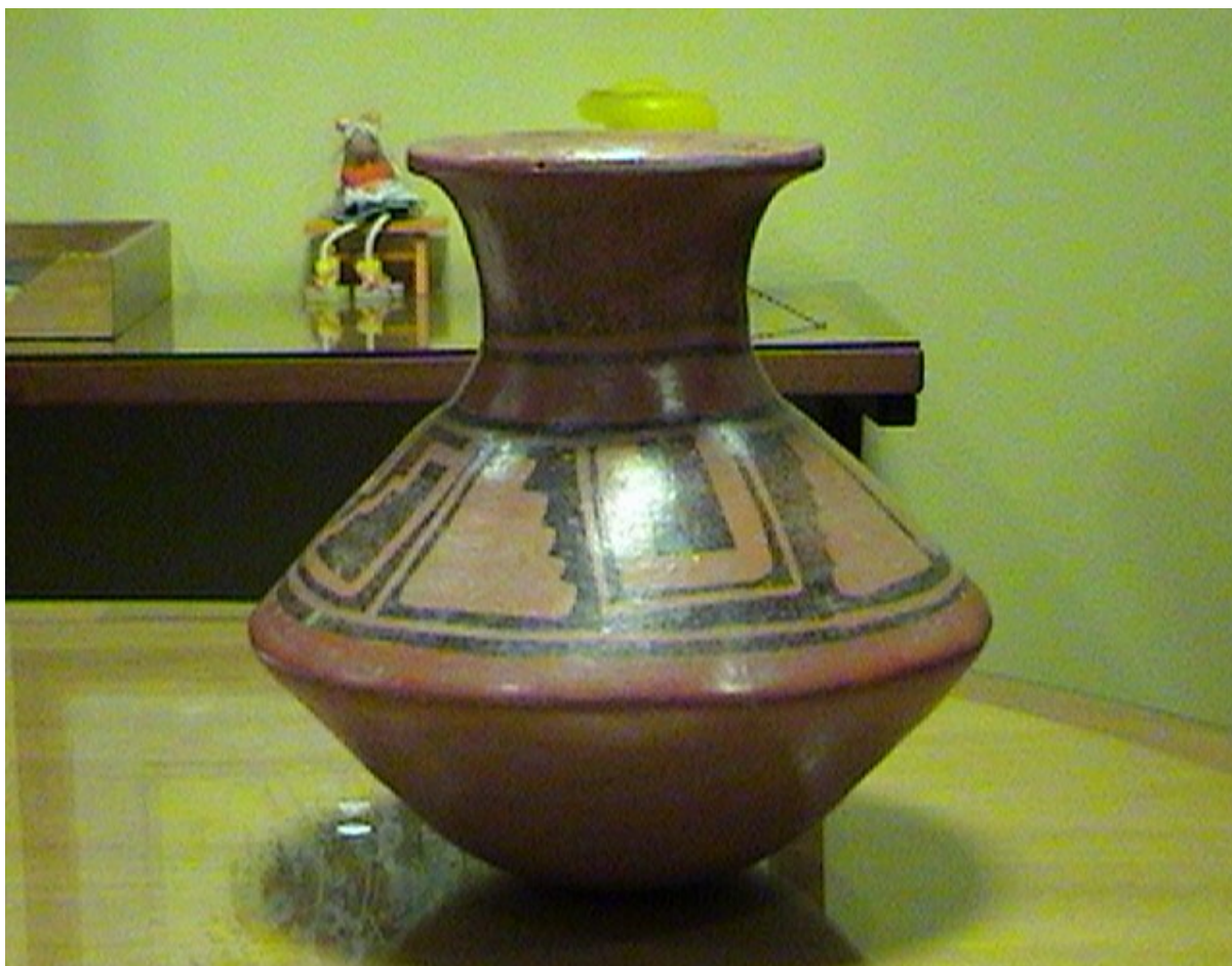
Fig. 17. Vasija de ritual del pacto. Colección CONAVI

La presencia de vasijas como las que se presentan en las figuras 7-12, indican que estos recipientes de algún modo formaban parte de una ceremonia o ritual de purificación, en la que había que resaltar que quién hacia uso de ella ingresaba a un santuario, para obtener la comprensión y el discernimiento- las dos figuras antropomórficas ubicadas en el brocal (fig.13), simbolizan los dos pilares que delimitan la puerta de entrada al templo de Salomón, con valores numéricos de 9 y 10 en sus entretejidos, cuya suma 19 corresponde con “el Arcano de la Luz deslumbrante del Sol”-que nos franquean el camino para el Pentecostés de la realización espiritual, para beber el líquido de la renovación del convenio o Bautismo del Espíritu, la segunda etapa de todo renacimiento 31 .