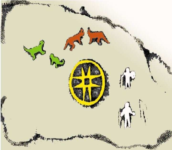
Fig 10 Piedra de Los Machines, Municipio de Cumbal