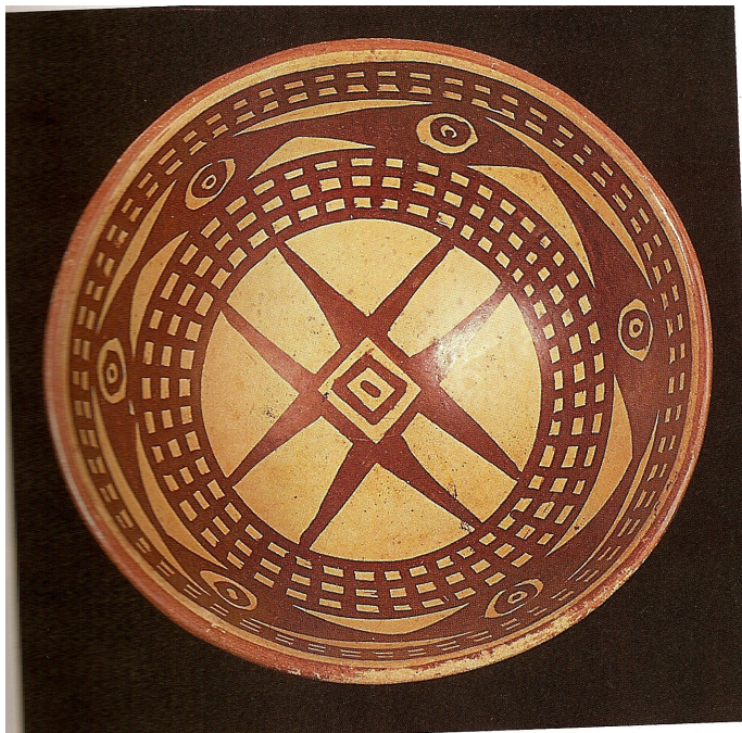
Fig. 15. Sol de los pastos representado en la piedra de Machines y en platos ceremoniales. Banco de la República.

.Esto legalmente esta configurado en un lenguaje simbólico, escrito para que personas comunes y corrientes no lo entiendan, y descifrable sólo para aquellas que han alcanzado el desarrollo de una alta espiritualidad y maestría, quienes tienen la llave de la interpretación de las cosas y su simbolismo.