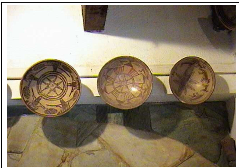
Fig. 16 Los platos de la creación Museo Alfonso Zambrano