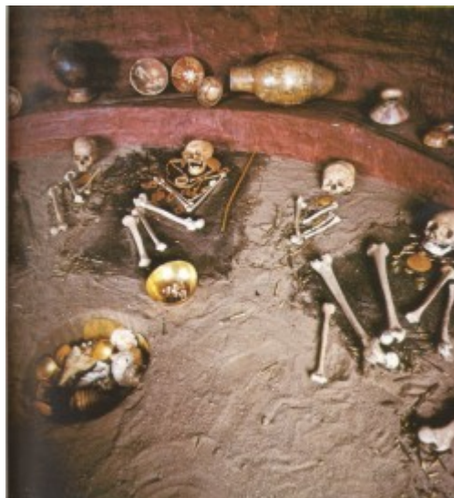
Fig. 2 Tumba Pasto. Museo del Oro Banco República

Supe que sus ancestros habitaron en toda la región del Sur del Departamento de Nariño y una parte del Norte del Ecuador, desde el Chota hasta Tulcán. Que en su trasiego familiar viajaron y se pasearon por todos los pisos térmicos de la Zona, donde los principales tenían parentelas desde Ecuador hasta Imbued; que los Táquerres visitaban mucho a los Barbacoas y Tumaco e intercambiaron víveres ,materiales, vasijas ,ollas platos y orfebrería; que la cerámica de los Principales siempre estuvo adornada de Jeroglíficos los cuales fueron confeccionados por escribas ,los cuales debieron recibir una adecuada instrucción en este arte, pues sus pictogramas se emplearon tanto en inscripciones religiosas o conmemorativas