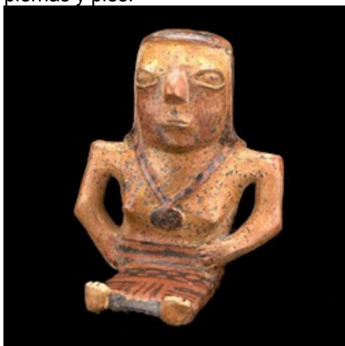
Fig.14 Estatuilla escribano Pasto con el disco colgante del cuello. Museo del Oro Banco de la República

Los discos al ser colgados de un cordón, a manera de péndulo servían para focalizar puntos de energía en el cuerpo humano, se colocaban encima de la cabeza del enfermo para medir la entrada de energía. En posición horizontal la persona identificaba el estado de funcionamiento de: el cerebro, la vista, el olfato, la garganta, el corazón, el estómago e intestinos, actividad sexual, afecciones musculares en las piernas y pies.