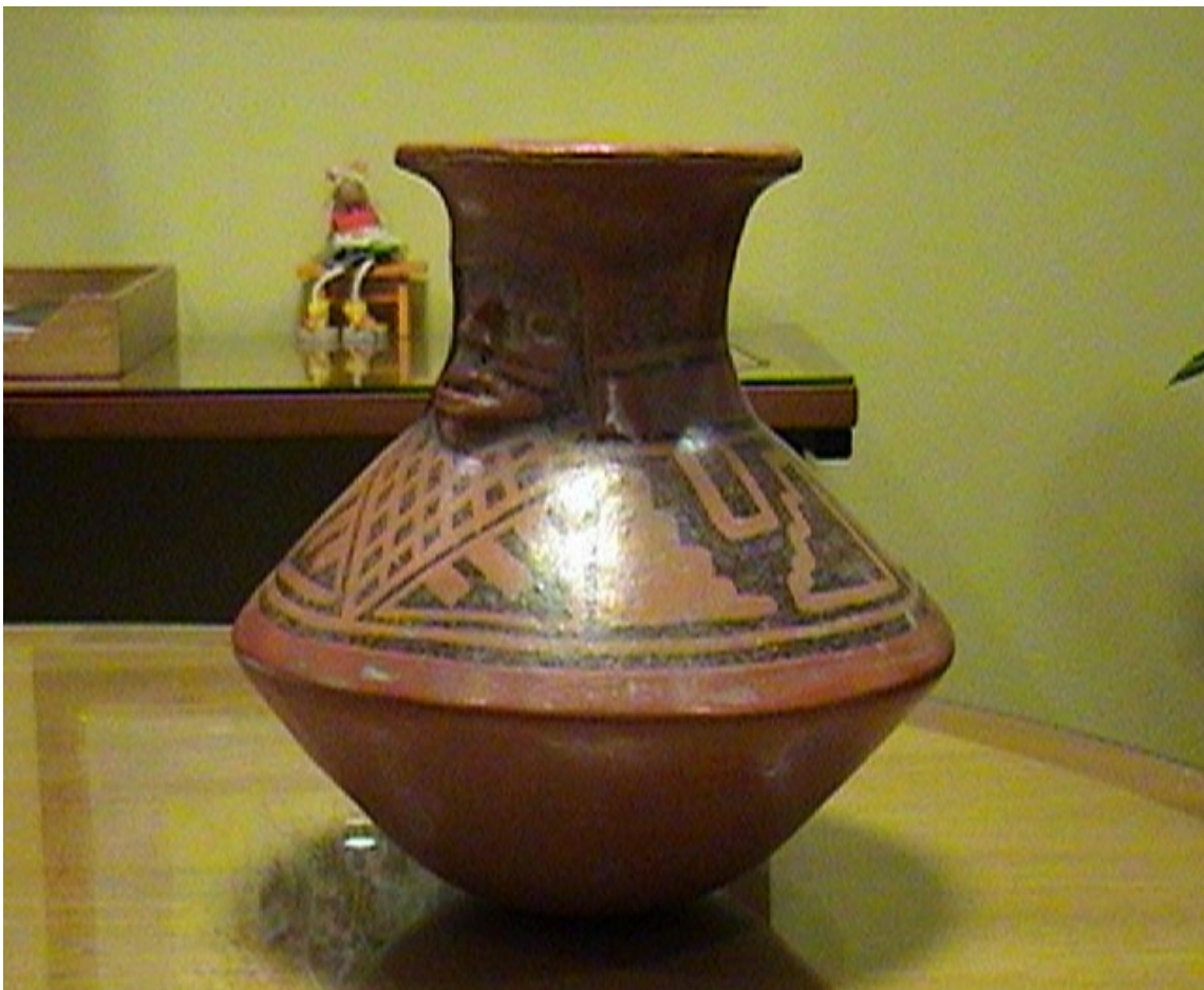
Fig. 11. Vasija ceremonial. Colección CONAVI