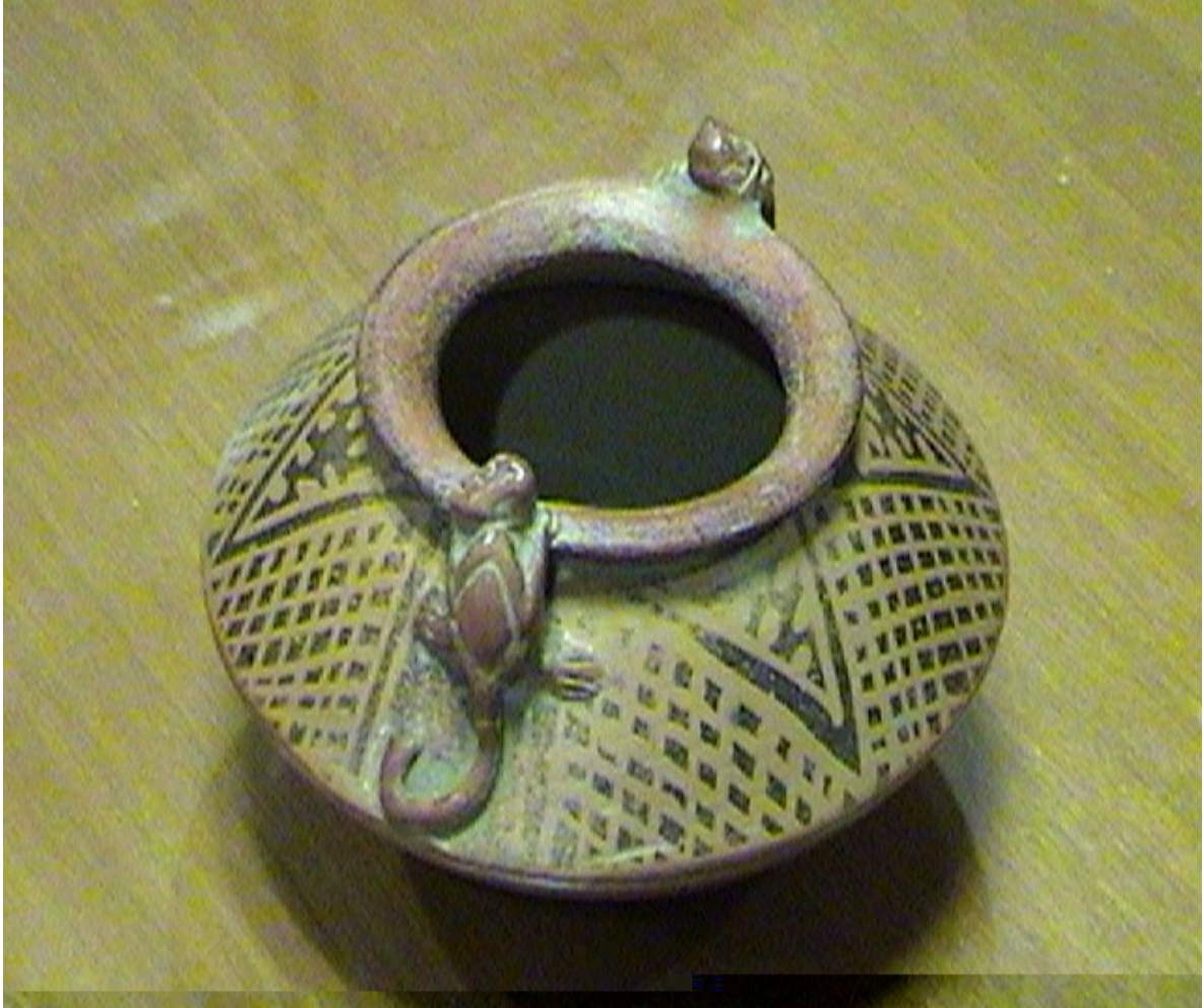
VASIJA DE LA LARGA VIDA Fig. 12: COLECCIÓN CONAVI

Observe la disposición de los dibujos enmarcados en triángulos, en los que se destacan las escaleras y los rombos energizadores. Esta Vasija es la mejor conservada de un centenar observado, algunas se indican al final de la bibliografía consultada.