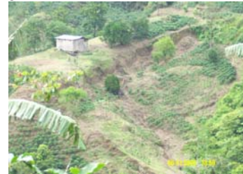
Ilust. 6 Efectos de un movimiento de laderas.