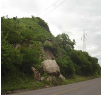
Ilust. 4 Derrumbe de Roca en Talud de Carretera Estelí hacia Condega en Cortesía de T. Obando

Los factores condicionantes no siempre establecidos con seguridad, juegan un papel definitivo en el desplazamiento del terreno ( Ilustración 4 ), particularmente, tipo de rocas (muy fracturadas, mala calidad física) y el relieve (terrenos de mucha pendiente, y desprovistos de vegetación).