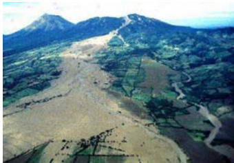
Ilust. 5 Flujo de lodo en Volcán Casita, Octubre de 2008.

Por otro lado, entre los factores que desencadenan la inestabilidad en las laderas, y que se puede destacar por su extremada importancia es el papel desempeñado por las lluvias ( Ilustración 5 ), sismos, acciones humanas (deforestación, rellenos mal compactados, vertederos de residuos sólidos muy suelos, y otros), erosión hídrica, acción del agua subterránea, aplicación de cargas estáticas y dinámicas (por ejemplo, el excesivo tránsito vehicular, la construcción de carreteras, puentes, y otros).