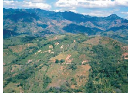
Ilust. 2 Laderas empinadas y escarpadas regiones montañosas del país

capacitar a los ciudadanos para enfrentar eficazmente estos fenómenos y contribuir al fortalecimiento de la cultura de protección civil en Nicaragua.