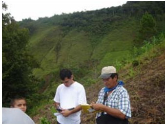
Ilust. 8. Monitoreo en campo

Para llevar a cabo el trabajo en campo ( Ilustración 8 ) es necesaria la selección de magnitudes a medir, de los puntos de medida y de los instrumentos adecuados, además de un correcto registro e interpretación de las medidas que justifique la declaración de un estado de alerta.