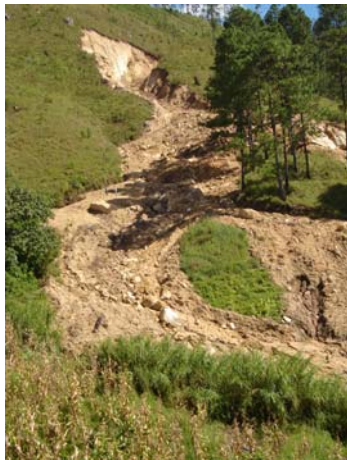
Ilust. 1 Cerro El Perote (Dipilto Nicaragua)

pérdidas de vidas humanas. Ejemplo de estos, el deslizamiento en Cerro El Perote (Ilustración 1) en la Ciudad de Dipilto (Nueva Segovia) en Septiembre 2007.