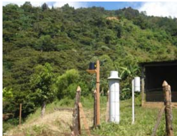
Ilust. 9 Pluviómetro de lectura.

La unidad de medida es en milímetros (mm). Una precipitación de 5mm indica que si toda el agua de la lluvia se acumulará en un terreno plano si perderse nada, la altura de la capa de agua sería 5mm.