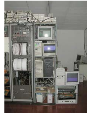
Ilust. 10 Sismógrafos instrumentales y digitales.