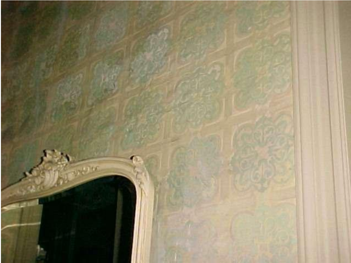
Imagen ( 324 ): Azulejos del baño del primer piso, estos azulejos no son del material que hoy conocemos, son de chapa pintada y pegada a la pared.