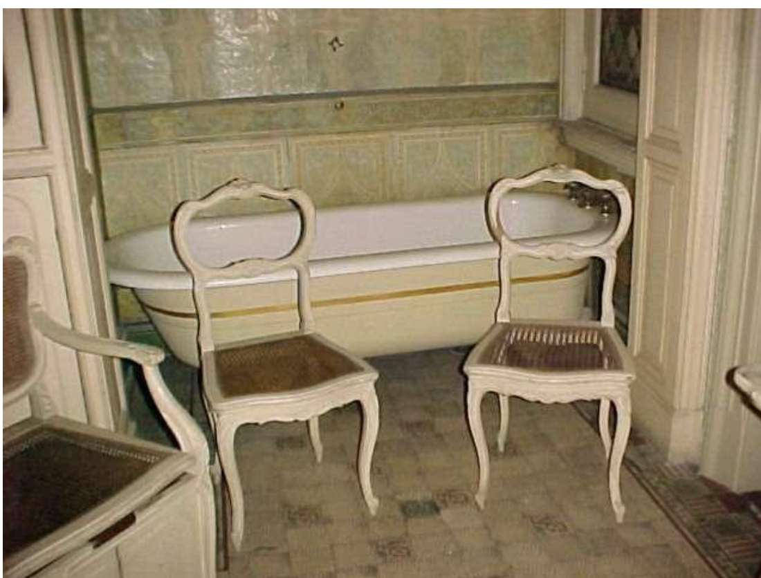
Imágenes ( 320 ) y ( 321 ): Arriba, sillón con respaldo y asiento de esterilla para bacinilla, correspondiente al juego de baño estilo Luis XV en el primer piso de la casa (antecedente del inodoro). Abajo, bañera con agua corriente.