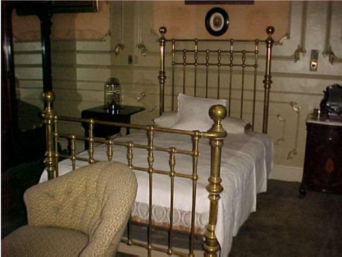
Imagen ( 325 ): Dormitorio contiguo al escritorio privado en la planta alta de la casa, sugiere la faceta cotidiana familiar del dueño de casa. Mitre murió en este dormitorio el 19 de enero de 1906 a los 84 años.