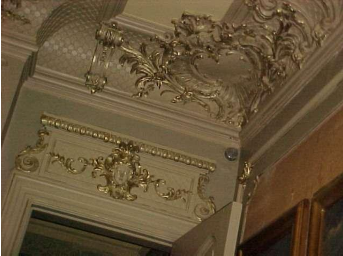
Imagen ( 333 ): Detalle del techo del escritorio de Mitre.

Por otro lado, la Quinta Jovita es un único y excelente ejemplo que, aún hoy, se conserva intacto, testimoniando las formas de vida de la burguesía surgiente de la ciudad de Zárate (al norte de la provincia de Buenos Aires), hacia fines del siglo XIX (aproximadamente data de 1870).