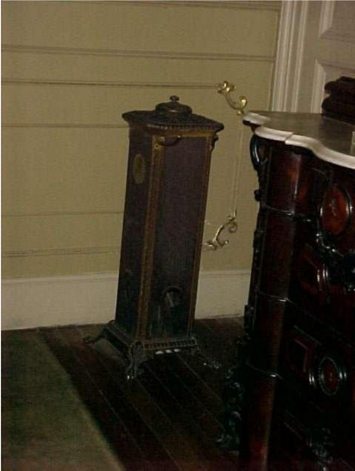
Imagen ( 328 ): Estufa eléctrica del dormitorio de la residencia Mitre.