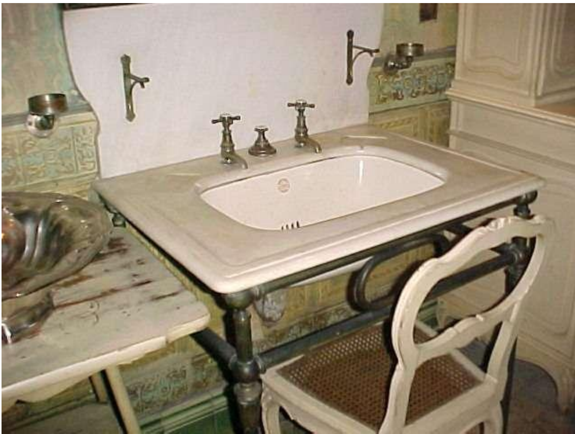
Imágenes ( 322 ) y ( 323 ): Lavatorio de cara y manos con agua corriente, con jarra y jofaina para lavarse la cara y manos.