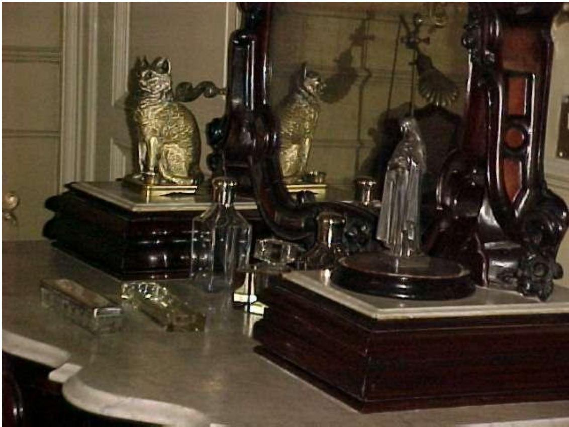
Imagen ( 329 ): C6moda del dormitorio de Mitre.