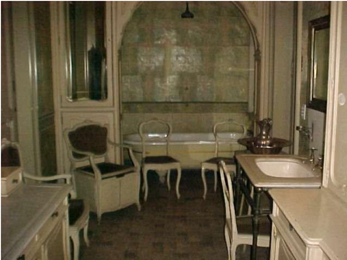
Imagen ( 319 ): Juego de baño c.1900 estilo Luis XV. Las ricas maderas de jacarandá, palo de rosa, embellecen el estilo del mobiliario.