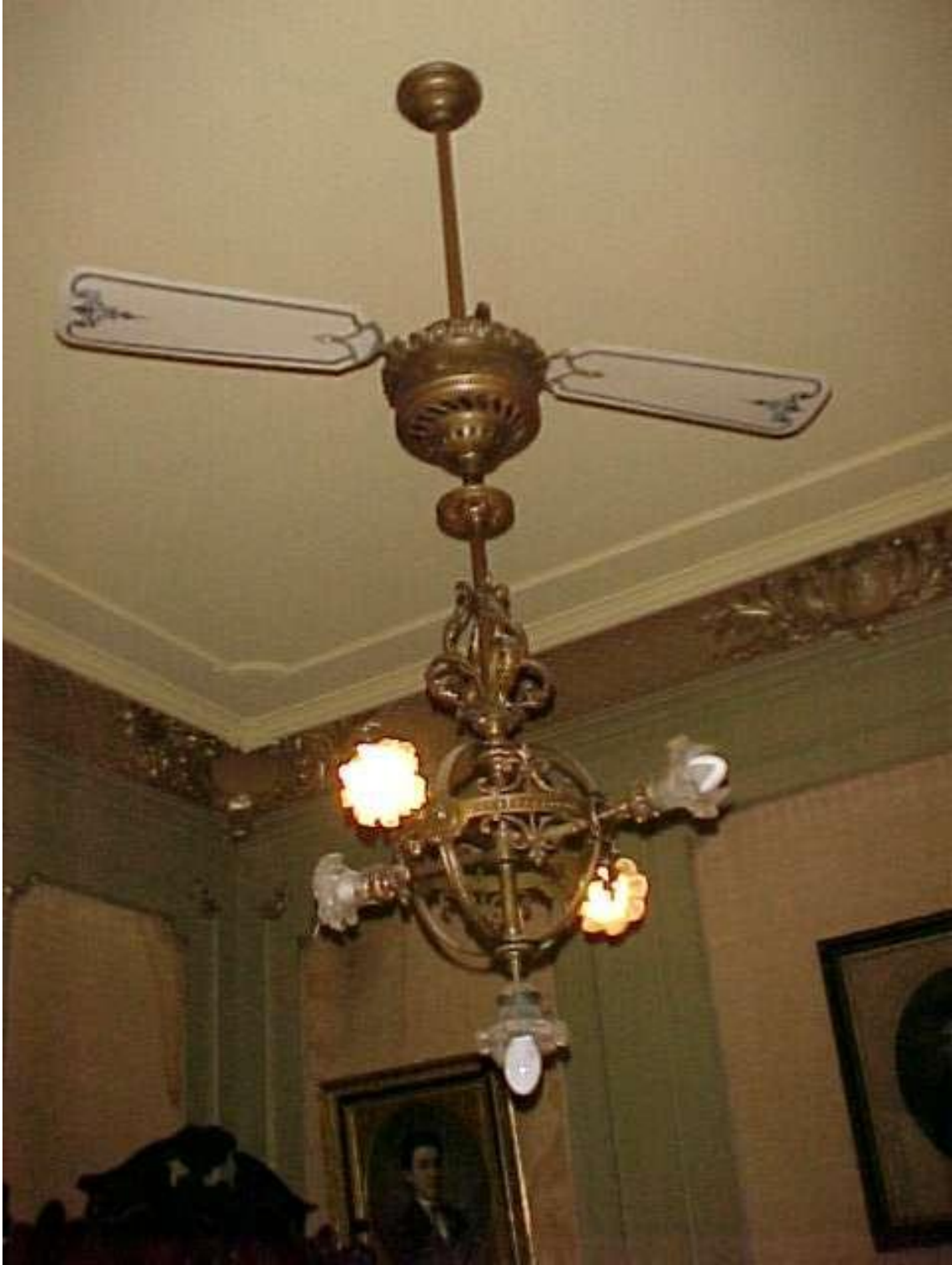
Imagen ( 327 ): Luminaria y ventilador de techo del dormitorio de la residencia Mitre.