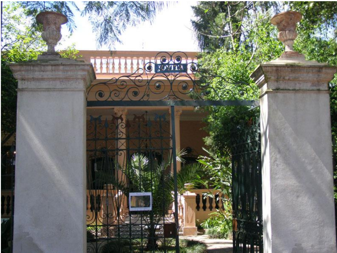
Imagen ( 334 ): Puerta de acceso de la Quinta Jovita.