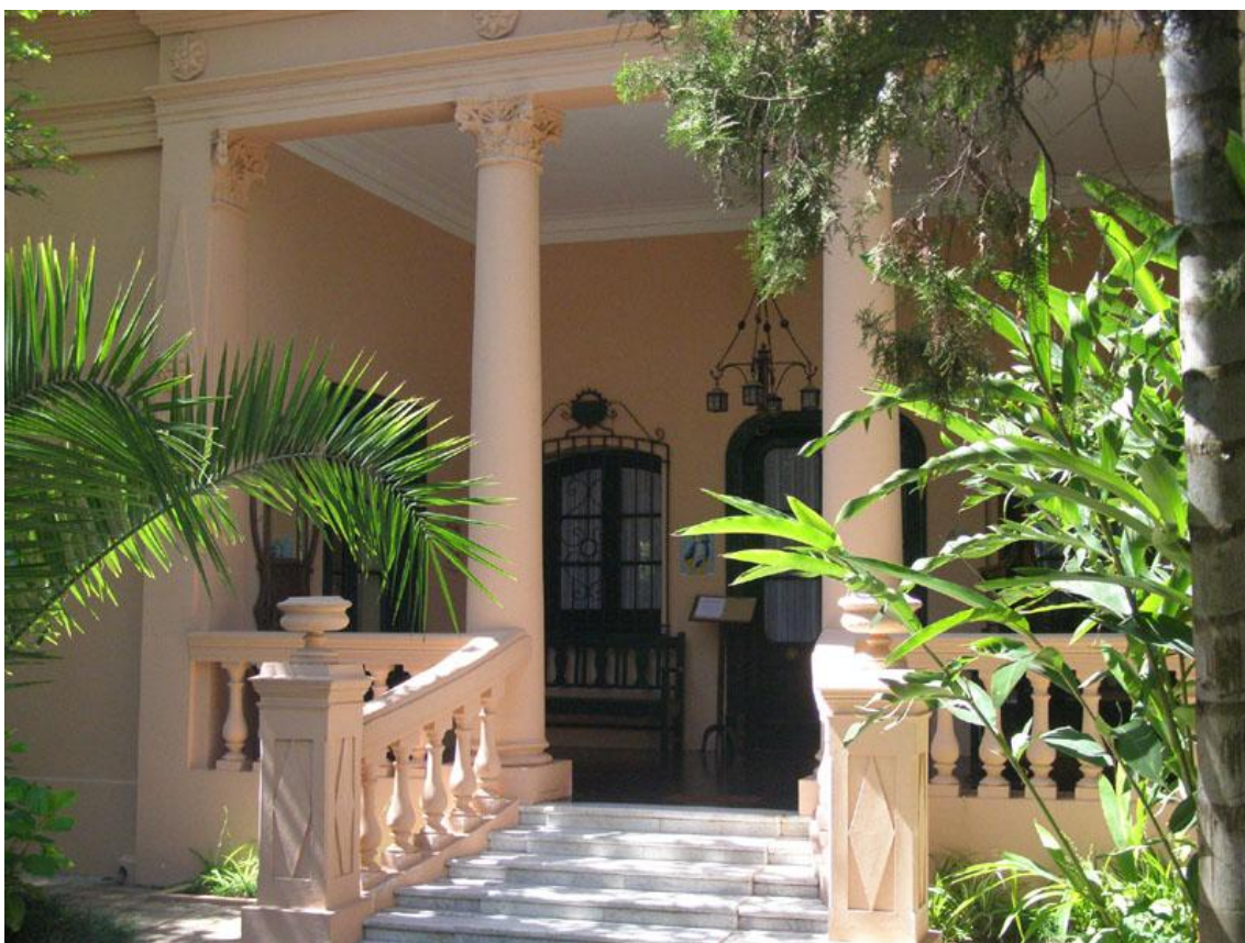
Imágenes ( 335 ) y ( 336 ): Fachada de la Quinta Jovita.