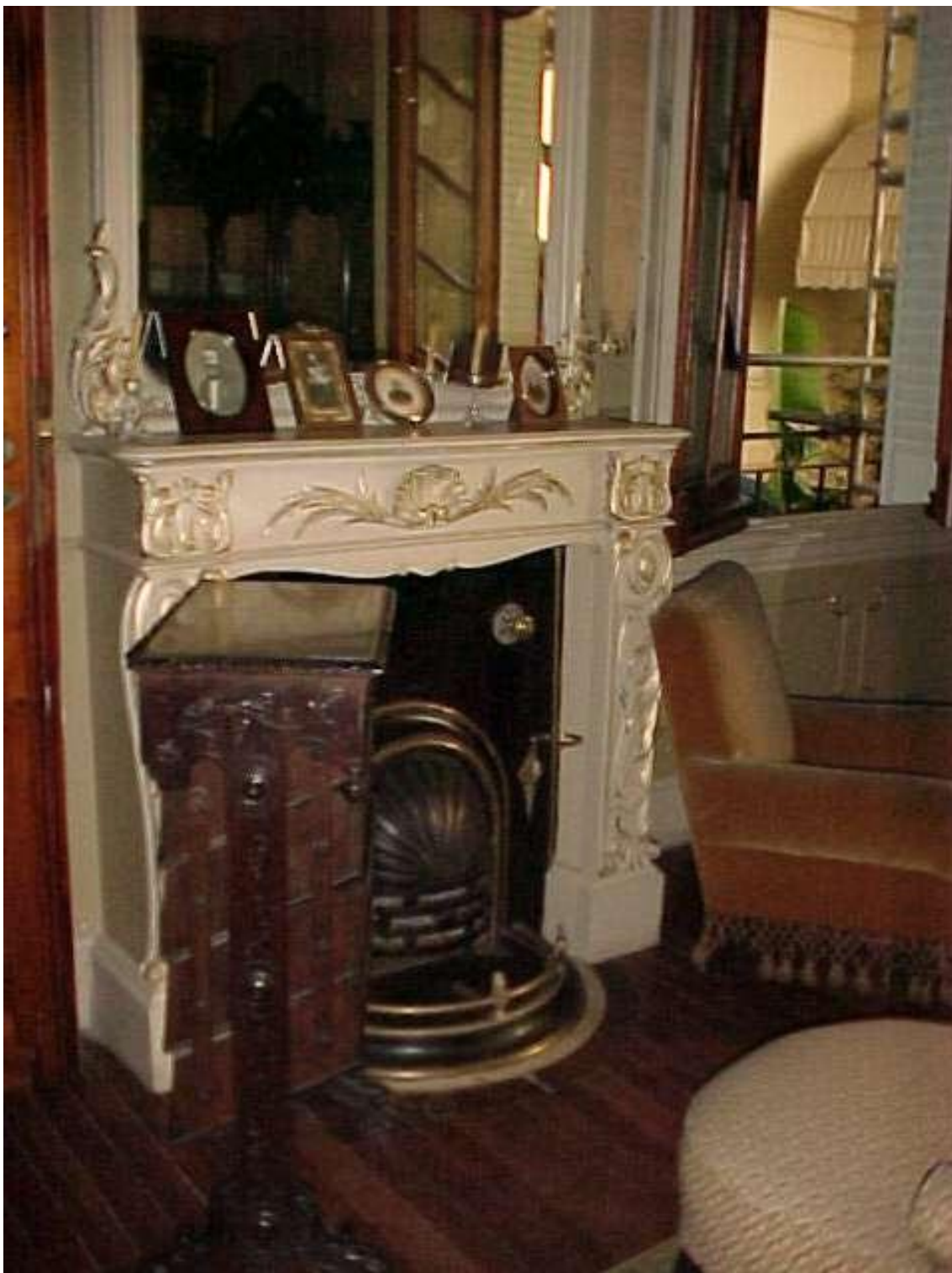
Imagen ( 330 ): Hogar a leña ubicado a los pies de la cama de Mitre.