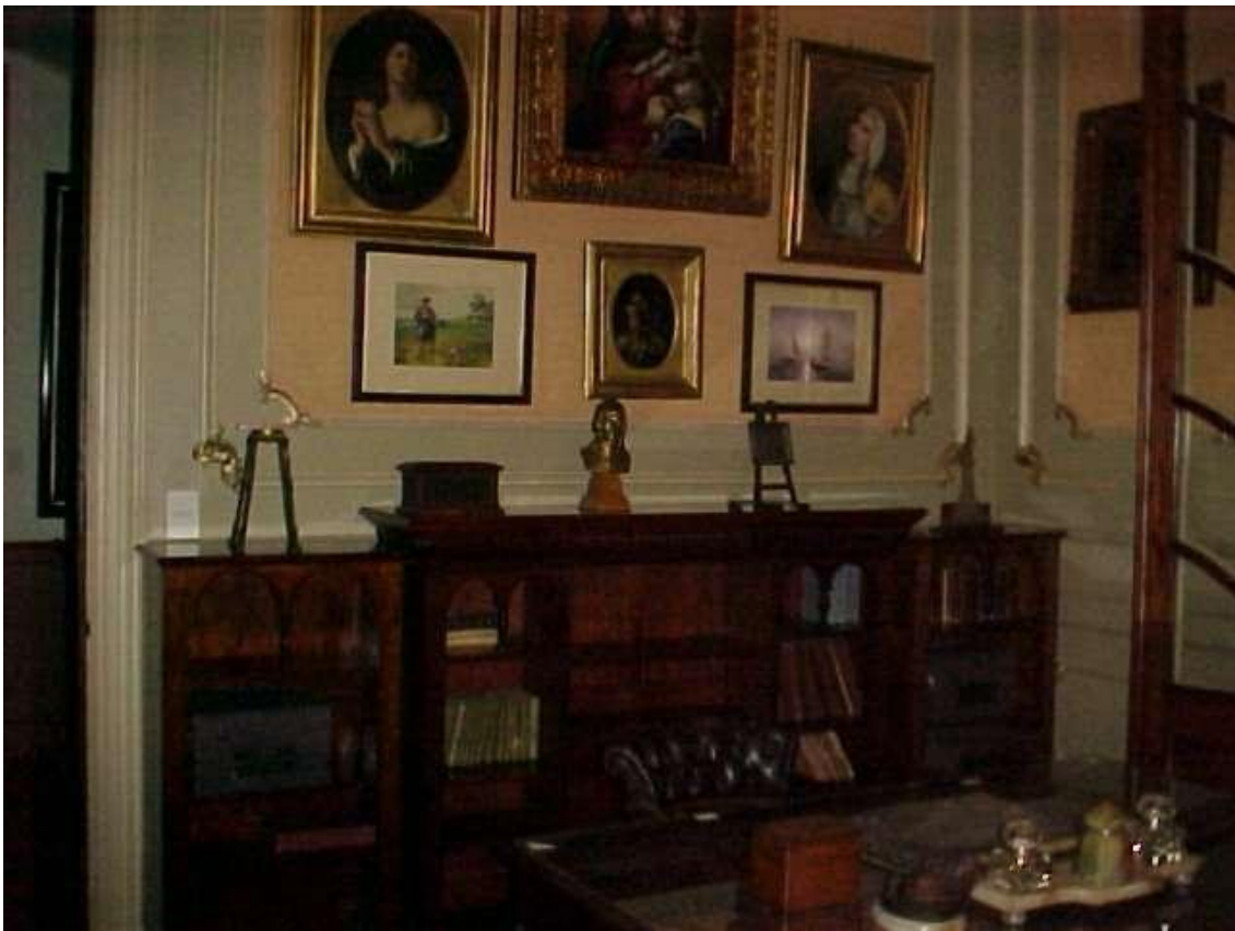
Imágenes ( 331 ) y ( 332 ): Escritorio de Mitre en el cual trabajaba en las horas de la tarde cerca de su dormitorio, en el mueble del fondo reunía las distintas ediciones de sus obras.