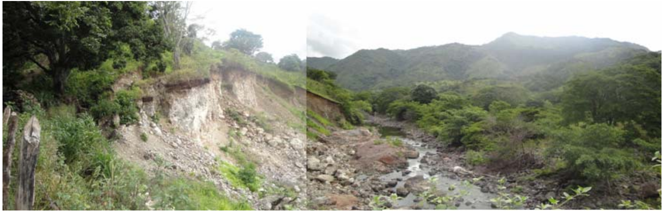
Foto 4. A la izquierda cercado del corral, cárcavas de erosión y derrubios del talud. Al centro el canal de erosión del río, aun activo durante la época del estiaje. La vista es al Norte, aguas abajo del río.