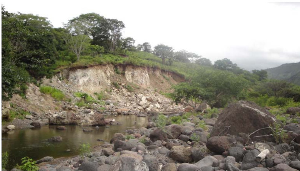
Foto 1. En primer plano el talud del cauce del río (segundo escalón) sujeto a la actividad fluvial. Al fondo parte del escarpe reciente (primer escalón) reconocido por la base de los árboles, en la parte alta de la ladera del margen izquierdo del Río Estelí.