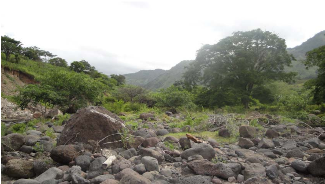
Foto 5. Se observa la abundancia de materiales depositados por la actividad fluvial del Río Estelí, caracterizada por el predominio de rodados del tamaño bloque. La dirección de la corriente es la opuesta al observador.