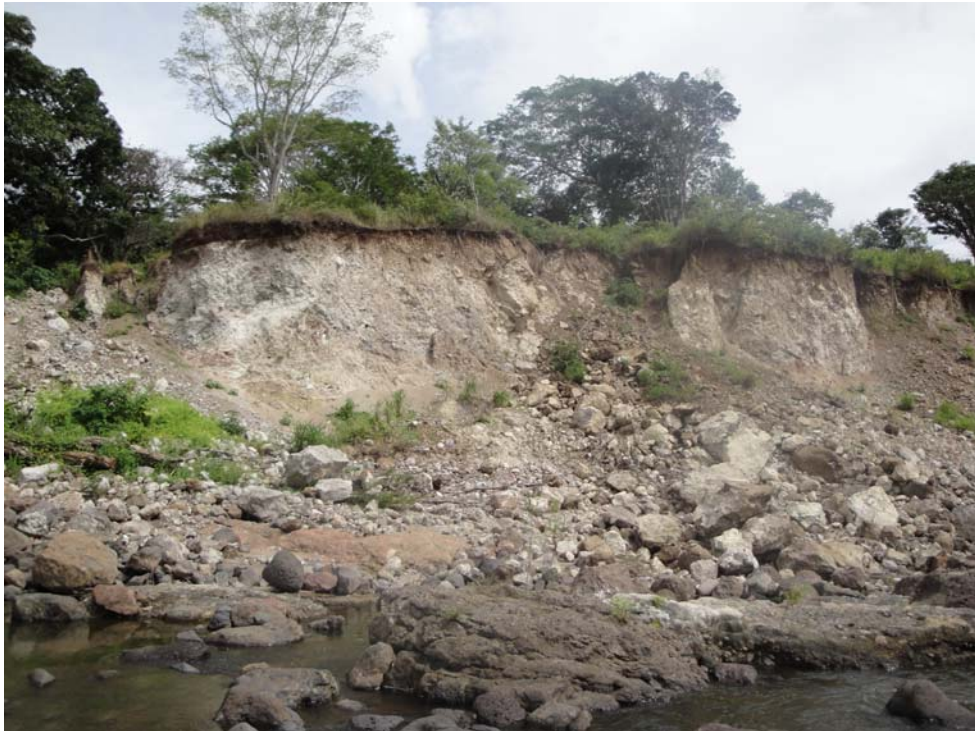
Foto 3. Detalle de condición de fractura, alteración y meteorización de la roca que conforma el talud. Se reconoce la formación de cárcavas, caída de escombros y la predisposición a caída de bloques de roca del borde del escarpe. Margen izquierdo del Río Estelí.