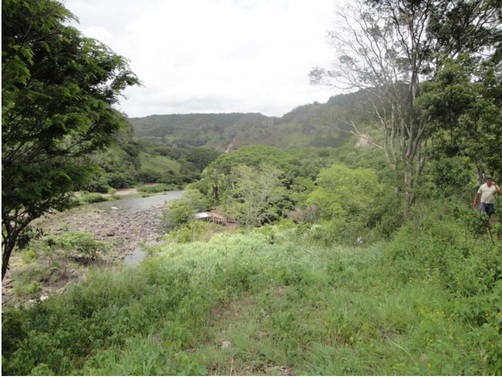
Foto 2. La vista es al Sur, aguas arriba de Río Estelí, desde la parte alta del escarpe superior. Se puede estimar su altura respecto al lecho del río. Su línea de rotura se sigue por los árboles y la persona. Desciende gradualmente en dirección al corral, al fondo, abajo, en el borde del talud del cauce del río