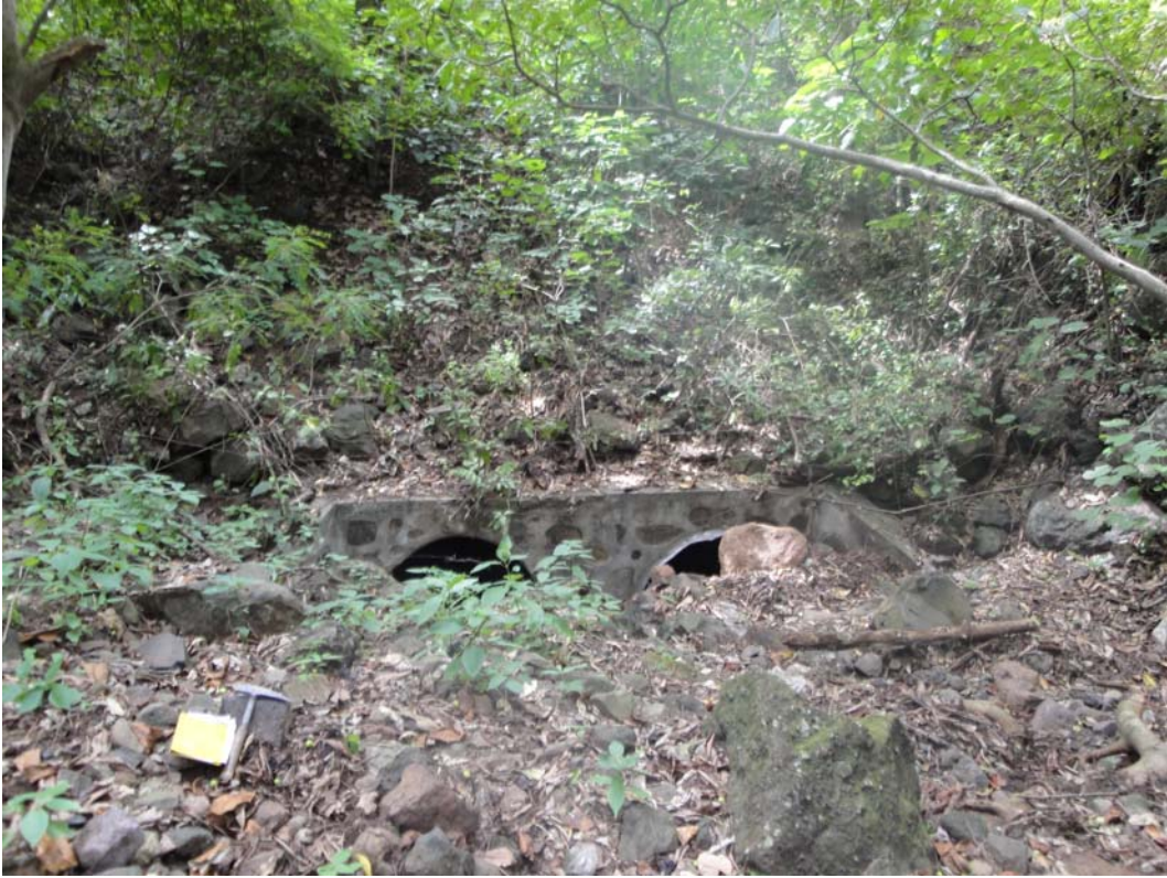
Foto 6. Obstrucción casi total de la alcantarilla de la carretera por rocas y escombros. Quebrada Yucusuma. Cuesta de Cucamonga. Carretera Condega –Estelí. El agua drena en la dirección del observador.