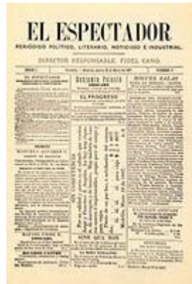
Figura 1 Facsímil del primer ejemplar del diario El Espectador

Fue EL ESPECTADOR el comienzo de varias publicaciones diarias que proliferaron a lo largo y ancho del territorio Colombiano. A partir de 1915, EL ESPECTADOR traslada su sede a la ciudad de Bogotá