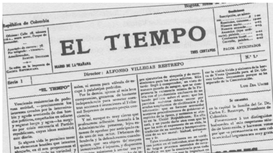
Figura 2. Facsímil del primer ejemplar del diario El Tiempo

Veinticuatro años después de circular por primera vez en diario EL ESPECTADOR, don Alfonso Villegas Restrepo funda en la ciudad de Bogotá el diario el TIEMPO, el 30 de enero de 1911. Dos años después es adquirido por Eduardo Santos Montejo, dando inicio