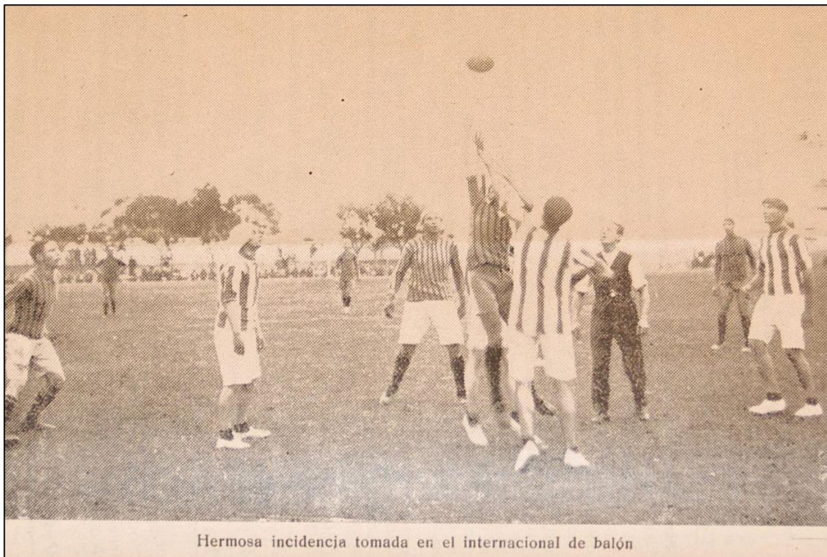
Higiene y Salud – Escenas del partido en el Parque Central

De esta forma el equipo de Balón de Sud América queda definitivamente en la historia de este deporte, al haber disputado el primer partido internacional en nuestro país.