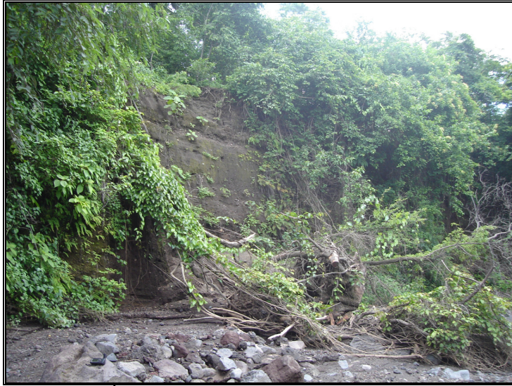
Fotografía 4. Árbol y coluvios caídos en el cauce, aportan detritos al flujo. Ladera Sur del Volcán San Cristóbal