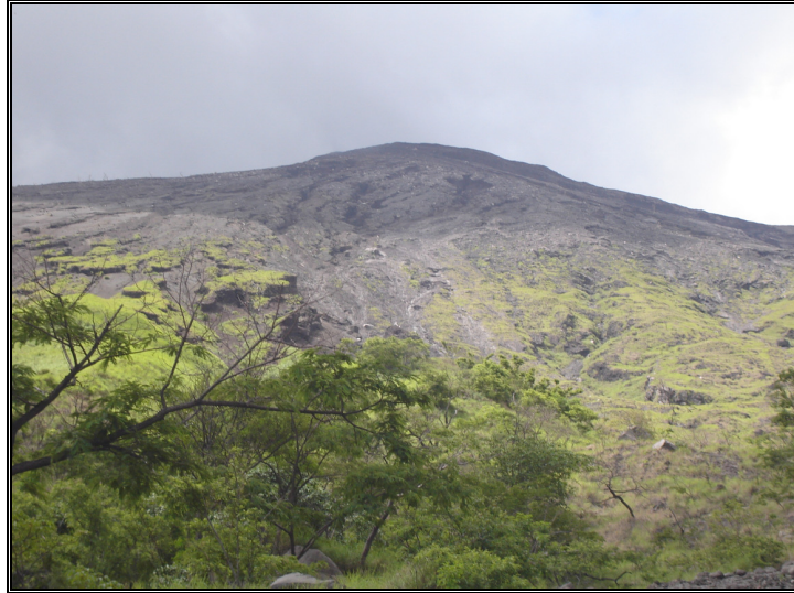
Fotografía 2. Condición de susceptibilidad a la erosión de la ladera Sur. Es el área fuente principal de material para lahares.

El flujo rebasaría la hombrera natural del cauce, desparramándose por la ladera, pudiendo tomar un nuevo curso. En tal caso, afectaría a personas y propiedades ubicadas no solamente sobre su trayectoria sino a las ubicadas más allá de su borde. (Fotografía 3)