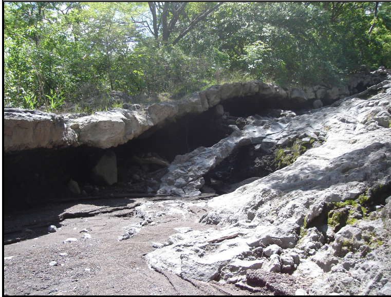
Fotografía 5. La lava es masiva. El aglomerado es erosionado y contribuye como carga de fondo del flujo. Ladera Sur del San Cristóbal