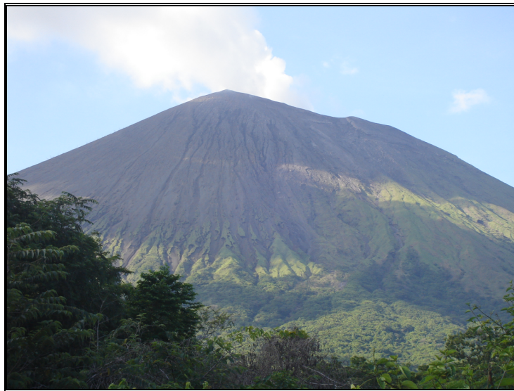
Fotografía 1. Aspecto general de la ladera Sur del Volcán San Cristóbal

La superficie de la parte alta de la ladera, desde el borde exterior del cráter, (1,745msnm) a aproximadamente la cota de los 900msnm, muestra coloración-gris oscura y manchones verdoso. La ladera es cortada por acanaladuras longitudinales que descienden radialmente desde su cima y cubren un área de varios Km 2 . No se observa coloración gris-clara-blanca en la ladera. (Fotografía 1)