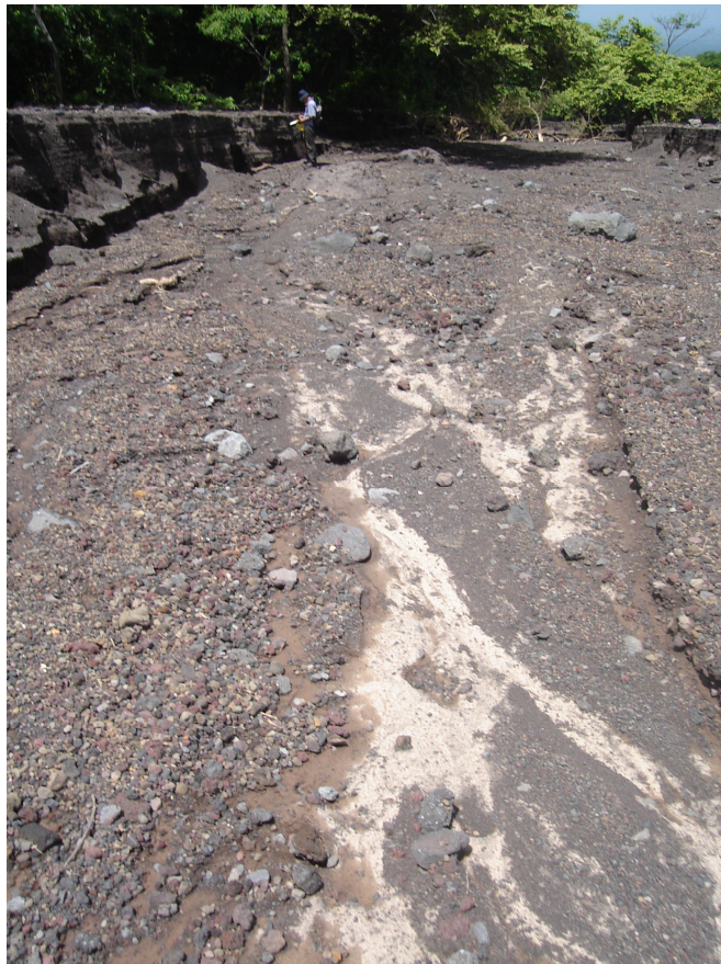
Fotografía 6. Exposición en el fondo del cauce de anterior lahar. Ladera Sur del Volcán San Cristóbal