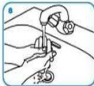
Enjuáguese las manos con agua