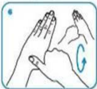
Frote rotativo del dedo pulgar izquierdo sujeto en la mano derecha y viceversa