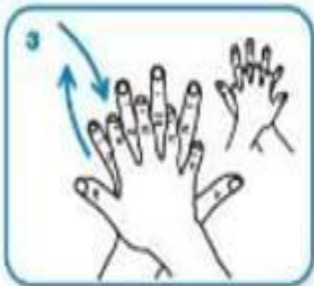
La mano derecha sobre el dorso izquierdo, con los dedos entrelazados, y viceversa