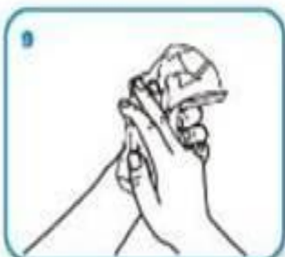
Seque sus manos con una toalla desechable