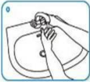
Humedezca sus manos con agua