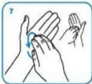
Frote rotativo, hacia atrás y adelante, con los dedos sujetos en la mano derecha en la palma izquierda y viceversa