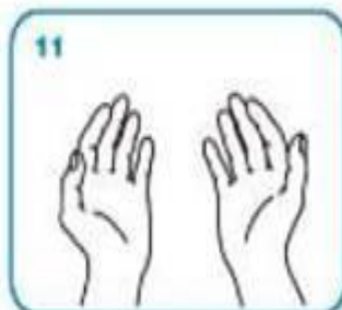
... y sus manos estarán seguras