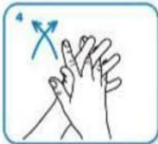
Palma con palma, con los dedos entrelazados