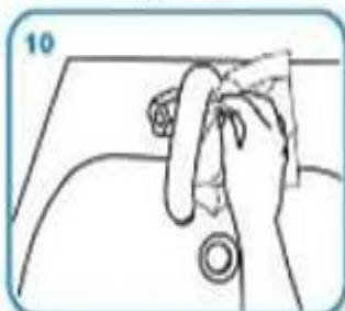
Utilice la toalla desechable para cerrar el grifo