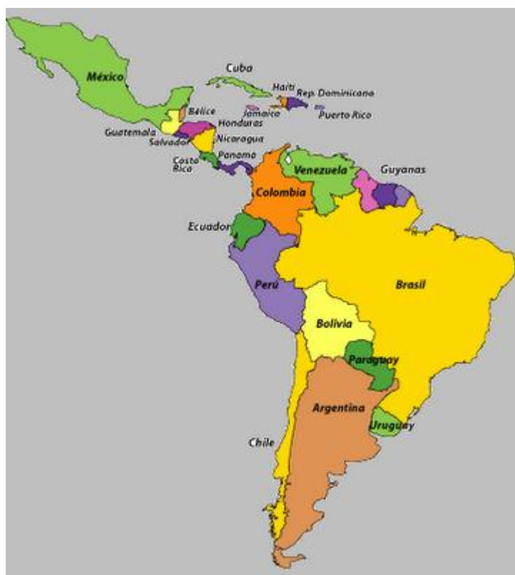
Gráfico3.Mapa de América Latina y el Caribe.

Brasil ( Portugués), Belice ( Inglés), Guayana Francesa ( Francés), Surinam (Inglés).