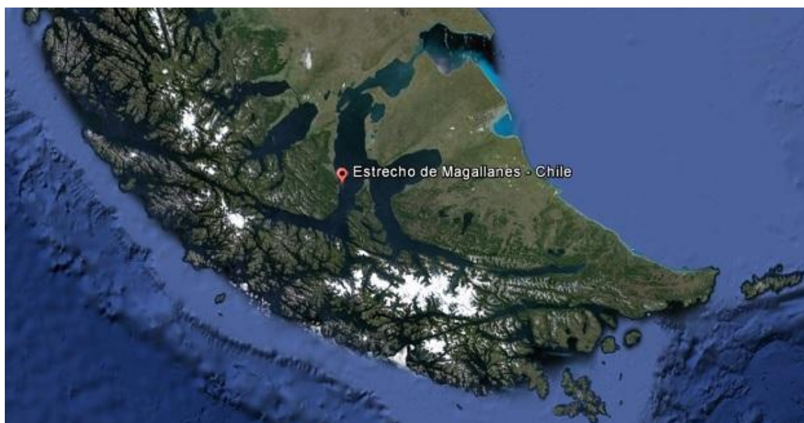
Gráfico 1. Estrecho de Magallanes.

de Río de la Plata ( Argentina)1776 . Más de trescientos años se mantuvo América bajo la dominación colonial por parte de España, Portugal, ( en el centro y sur del continente) Francia e Inglaterra ( en el norte). En 1513 una expedición partida desde el “Nuevo Mundo” encabezado por Vasco Nuñez de Balboa descubre el mar del sur (Océano Pacífico,166.242.754 kilómetros de longitud. Es el mayor de los océanos ,limita al norte con el estrecho de Bering, al sur con la región Antártida, al este con el continente americano y al oeste con Asia y Australia), y en 1820 Fernando de Magallanes descubre el estrecho que lleva su nombre, éste estrecho se halla entre la costa continental y Tierra del Fuego (Chile), comunica a los océanos Atlántico y Pacífico, posee una longitud de563 kilómetros y una anchura de 33 kilómetros.