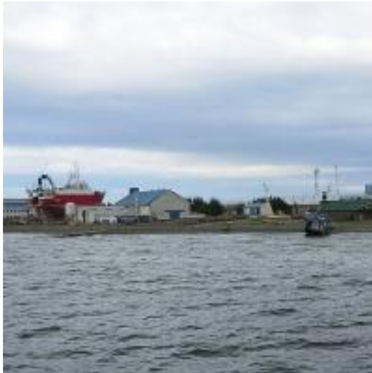
Gráfico 2. Punta Arenas-Chile. Estrecho de Magallanes.