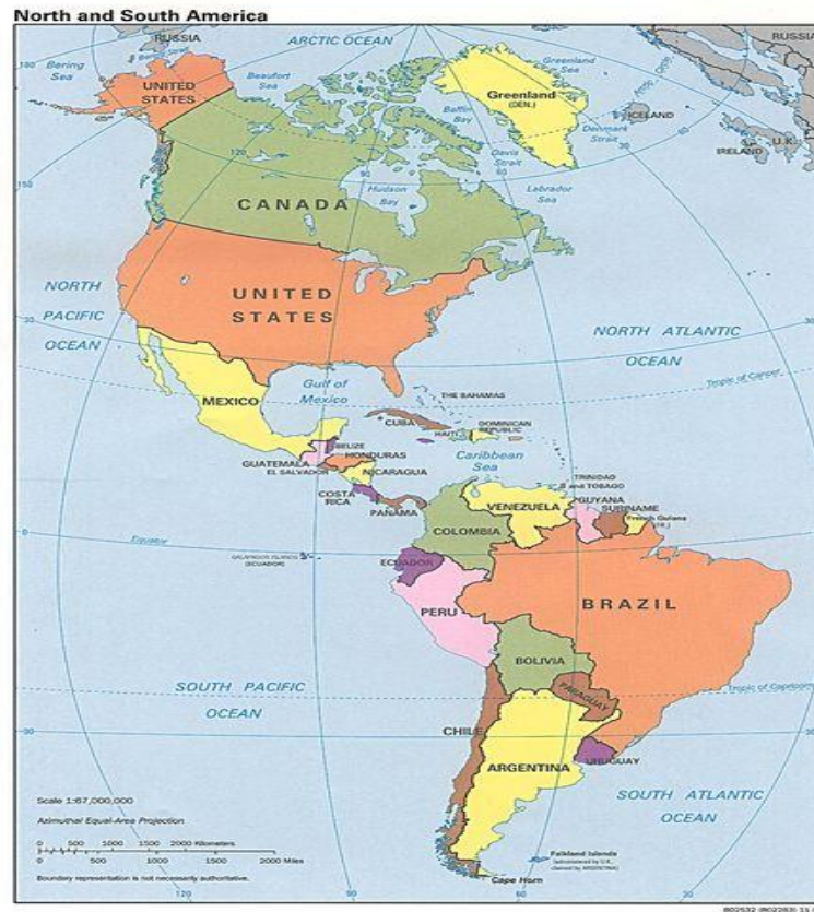
Gráfico 4. Mapa del continente Americano desde el Norte al Sur.