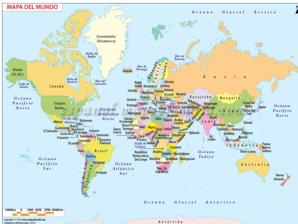
Gráfico 5. Mapamundi.

En los gráficos 3 y 4 se observan el conjunto de países e islas del Caribe que conforman a América Latina, observando el gráfico 5, podemos apreciar que el continente americano en su totalidad se halla en el Hemisferio Occidental, por tanto si podemos afirmar que América Latina si es perteneciente al mundo Occidental, al menos geopolíticamente hablando. La inquietud por saber si América Latina pertenece al mundo occidental es que es éste subcontinente la única parte del mundo occidental que es TERCER MUNDISTA y atrasada con respecto al PRIMER MUNDO.