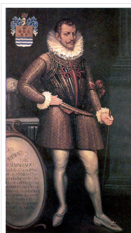
Retrato de Pedro de Alvarado con la cruz de la Orden de Santiago.