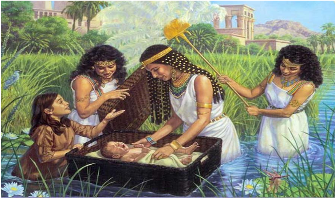
.Fig.3-Fotografía de Moisés en el río Nilo.

Por supuesto, el Faraón de Egipto no quería libertar sus esclavos. Tuvo que ser obligado a libertarlos. Dios me dio el poder de hacer diez grandes milagros. Cada milagro traía un desastre sobre los egipcios. Estos milagros se llaman las Diez Plagas