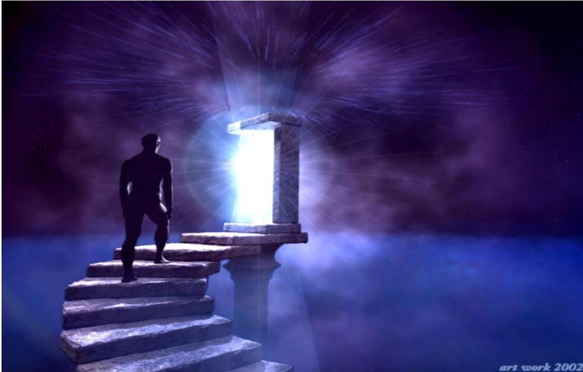
Fig. 1 -Fotografía. Camino a la Cuarta Dimensión.

Muchos cristianos suponen que los Espíritus de los Justos van a un lugar de Reposo y los Espíritus de la gente malvada van a un lugar de tormento. Bajo esta suposición la vida en la Tierra no está marcada con presencia de Justos, serían muy pocos, desconocidos entre los humanos; pero los del diario vivir son muchos los que cometen errores, quebrantan las Leyes, de tal manera que el espacio de los Justos debe ser pequeño comparado al de los inicuos o mal llamados pecadores.