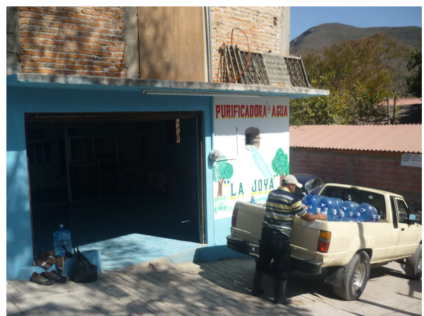
Foto de una de las purificadoras de Agua

Personas de Chilpancingo llevan a vender todos los días lunes productos como: cazuelas de barro, fibras para trastes, escobas, trapeadores, etc.