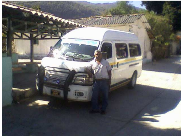
Unidad de Transporte Público, Amojileca-Chilpancingo.

Actualmente cuenta con 6 combis llamadas urvans, brindan el servicio de Amojileca-Chilpancingo. De las cuales de una de ellas es dueño la comunidad, otra es de los ejidatarios y las de más son de personas del pueblo.