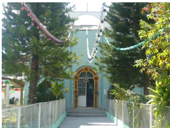
Iglesia Principal de Nuestra Señora de La Virgen De Guadalupe

El otro 1% son de la Luz del Mundo, cabe mencionar que hay personas que no radican ahí solo van de visita pero son nativos de ese lugar.