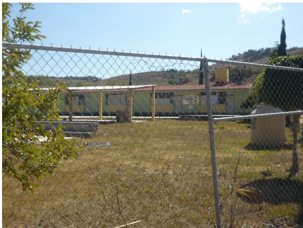
Escuela Telesecundaria Eucaria Apreza

Las clases se imparten en horario Matutino.