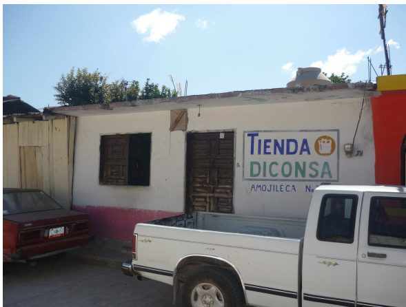
Tienda DICONSA, Amojileca Gro.

Se cuenta con una tienda Rural dependiente de la DICONSA, también cuenta con aproximadamente 15 tiendas de abarrotes, 2 tortillerías, 3 molinos para nixtamal, 2 purificadoras de agua.