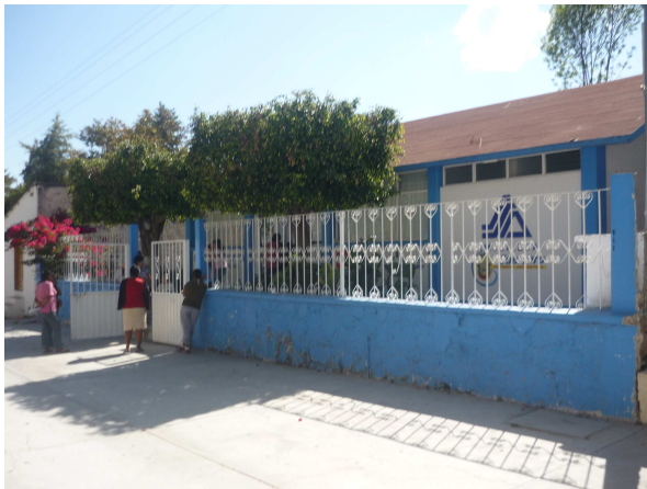
Centro de Salud Rural de Población Dispersa

La atención medica esta a cargo de un Centro de Salud Rural de Población Dispersa, lo cual Cuenta con 2 enfermeras y una Doctora.