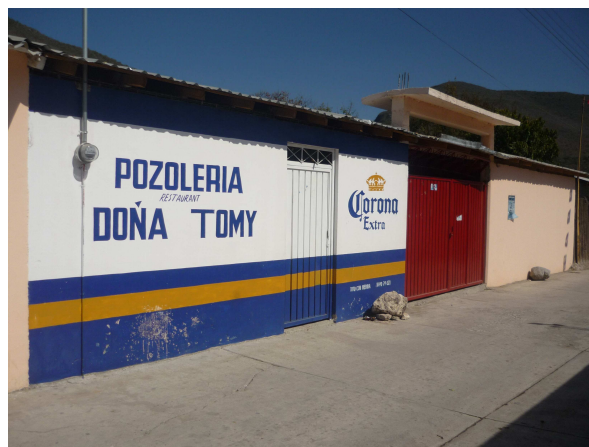
Una de las Pozolerias Restaurant del pueblo

Cuenta con 6 restaurantes, de los cuales los que resaltan mas son el restaurante los Magueyes, Pozoleria Doña Tomy y Pozoleria Lupita. Los cuales son visitadas por los capitalinos los días jueves de pozole, viernes de Mariscos, sábados y domingos.