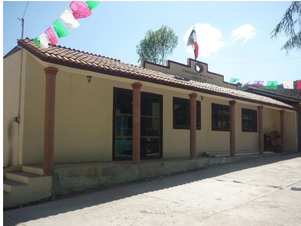
Comisaria Municipal de la Comunidad de Amojileca

Actualmente cuento con los servicios de luz, agua, drenaje, un panteón, una comisaria ejidal, una comisaria municipal, un registro civil, un panteón, una plazuela, una cancha de básquet bol, una plaza de toros, las calles están pavimentadas casi en su totalidad.