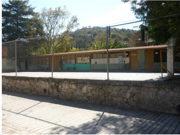
Esc. Prim. Josefa Ortiz De Domínguez

El Colegio Eucaria Apreza es una Escuela de Secundaria. Imparte Educación Básica (Telesecundaria), y es de control Público (Estatal). Atiende a 62 alumnos en total.