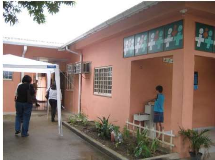
PSF 5 Marias