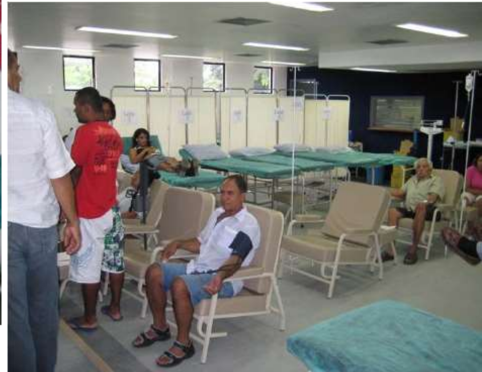
Policlínica Lincoln de Freitas Filho ( Santa Cruz)