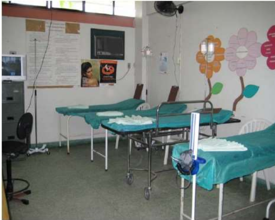
PS Alvimar de Carvalho (Ilha de Guaratiba)