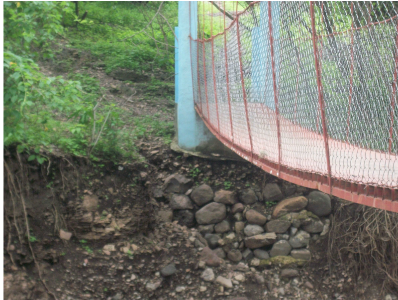
Punto Critico N2