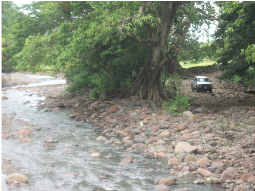
Punto Critico N3