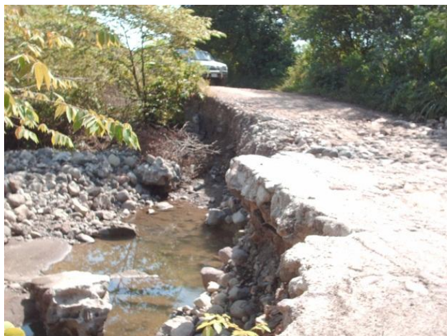
Comunidad La Gallera (Ciudad Darío, Matagalpa)