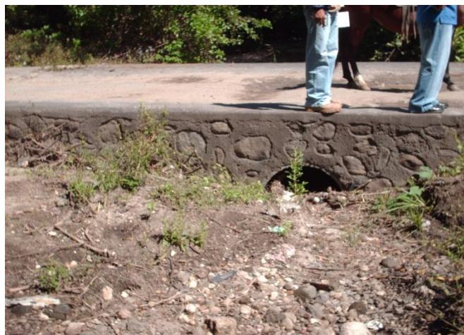
Comunidad El Hato Nuevo (Ciudad Darío, Matagalpa)