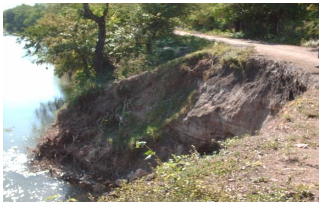
Comunidad Río Nuevo No. 2 (Sébaco, Matagalpa)