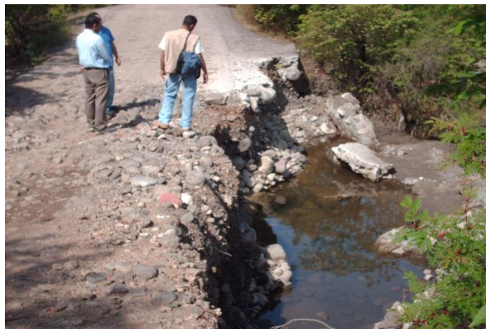
Comunidad La Gallera (Ciudad Darío, Matagalpa)