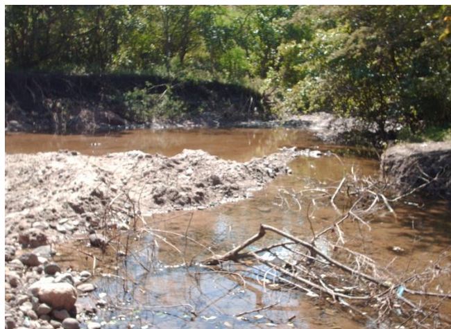
Comunidad El Hato Nuevo (Ciudad Darío, Matagalpa)