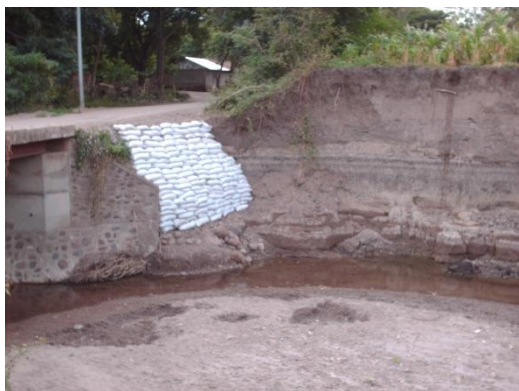
Villa Julián Roque (San Isidro, Matagalpa) 21-11-2011