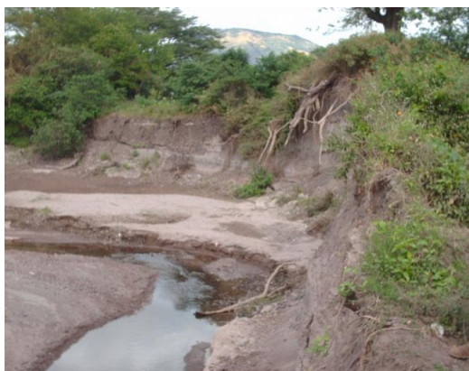
Villa Julián Roque (San Isidro, Matagalpa)