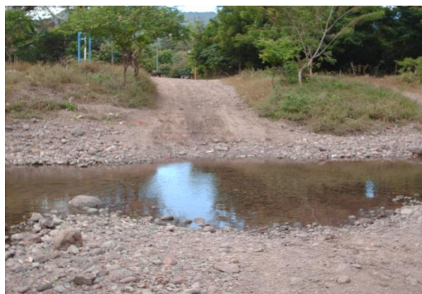
Villa Julián Roque (San Isidro, Matagalpa) 21-11-2011