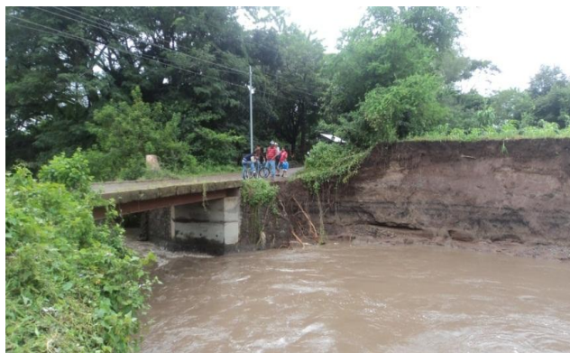
Villa Julián Roque (San Isidro, Matagalpa)