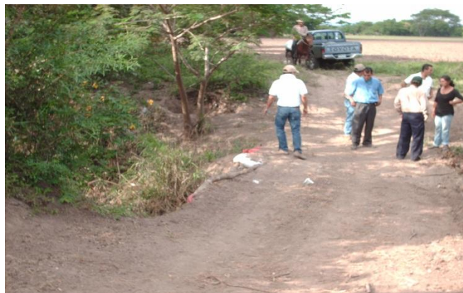
Comunidad La Chimpinilla (Sébaco, Matagalpa), 21-11-2011