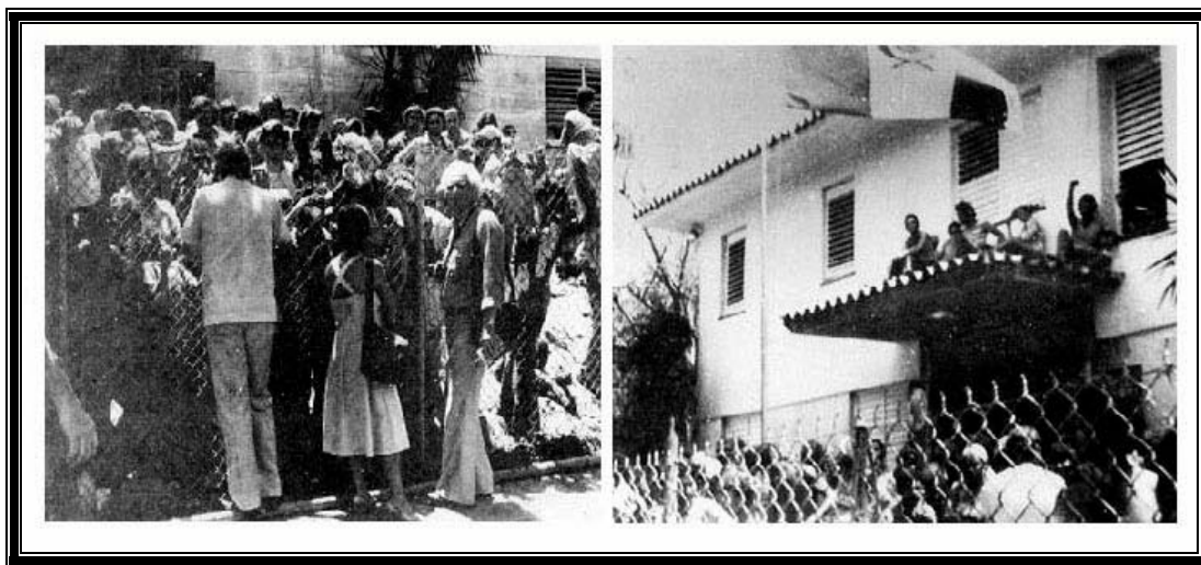
Sucesos de la Embajada de Perú en La Habana.