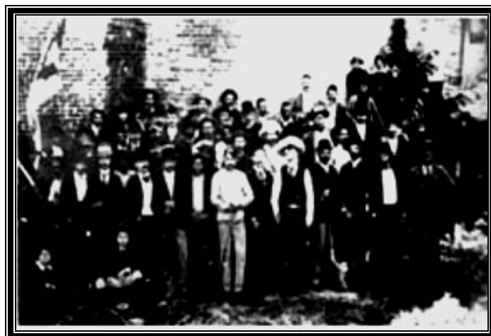
Emigrados cubanos de Tampa.

En 1902 Cuba se convierte definitivamente en una neocolonia norteamericana, en el transcurso de las primeras décadas del siglo XX la referencia cultural para la reproducción que se inoculaba a nuestra población, a través de las diferentes fórmulas y vías, incluyendo un poco más tarde los primeros experimentos massmediáticos, eran preconcebidos en el norte revuelto y brutal definido por Martí, se concretaba ahora, de esta forma, en el marco referencial cognoscitivo de nuestra población el viejo anhelo imperial de americanizar nuestra sociedad, aunque desde mucho tiempo antes se llevaba a cabo con éxito en los aspectos económico, financiero y político, aún siendo Cuba colonia española, estas pueden ser las causas fundamentales de la frecuente empatía cultural que se encuentra entre Cuba y EE.UU., se hace casi obligado recurrir nuevamente a Aja quién de manera muy concreta señala: