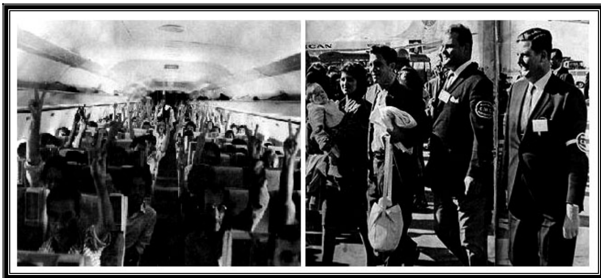
Los llamados Vuelos de la libertad.

Con la llegada de Jimmy Carter a la Casa Blanca se produce determinado mejoramiento de la política entre Cuba y E.E.U.U, se acordó permitir a los emigrados cubanos residentes en los EE.UU. visitar Cuba y contribuir a la reunificación familiar a través de la salida de presos y expresos contrarrevolucionarios, estos acuerdos sorprendieron a un amplio sector del pueblo cubano que no estaba preparado para ello, la llegada de la “Comunidad” – como se les llamó a los que viajaban – impactó a los dos lados, a los de E.E.U.U que encontraron una familia muy cambiada, un país diferente, en el momento económico de mayor esplendor luego del triunfo revolucionario y diferencias profundas respecto a lo que se “sabía de Cuba” en Miami, por otra parte, los cubanos de aquí tuvieron contacto con la otra realidad y comenzó la entrada a Cuba de productos y algún dinero de manera ilegal porque para ese momento se penalizaba por la ley la tenencia de divisas, aún así, entraba.