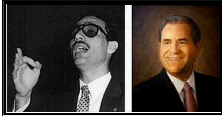
Rafael Díaz Balart y Jorge Mas Canosa dos exponentes del auto titulado exilio histórico.

Cambió entonces el patrón migratorio, Cuba pasó de ser un país receptor a emisor. Visto así puede parecer sencillo pero nada más lejos de la verdad, este es solo el comienzo de lo que ha devenido en un gran conflicto entre ambas naciones, la emigración cubana hacia Estados Unidos , comentada, analizada, vilipendiada según la postura del analista y claro está, en dependencia del lado en que se encuentre posicionado. Personalmente prefiero acercarme a este conflicto partiendo de verlo como una gran partida de ajedrez donde, a cada movida de las piezas blancas, se le responde con otra de las piezas negras y cada lado del tablero pone todo su empeño en evitar el jaque mate.