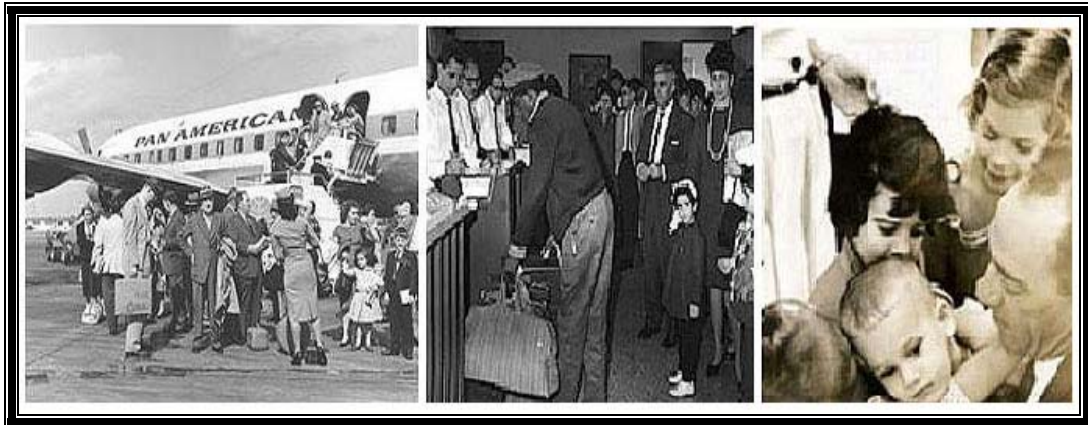
Operación Peter Pan.

Cambió entonces el patrón migratorio, Cuba pasó de ser un país receptor a emisor. Visto así puede parecer sencillo pero nada más lejos de la verdad, este es solo el comienzo de lo que ha devenido en un gran conflicto entre ambas naciones, la emigración cubana hacia Estados Unidos , comentada, analizada, vilipendiada según la postura del analista y claro está, en dependencia del lado en que se encuentre posicionado. Personalmente prefiero acercarme a este conflicto partiendo de verlo como una gran partida de ajedrez donde, a cada movida de las piezas blancas, se le responde con otra de las piezas negras y cada lado del tablero pone todo su empeño en evitar el jaque mate.