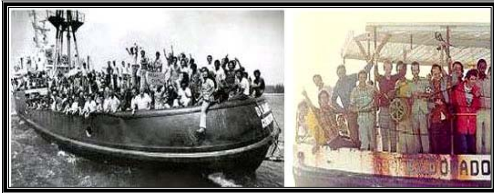
Embarques de cubanos por el puerto del Mariel

Se hace necesario hacer un paréntesis aquí, de ello depende que se puedan comprender apropiadamente algunos puntos que, posteriormente, ayudarán al lector a entender de manera adecuada algunas cuestiones inherentes al comportamiento de los emigrados cubanos en Estados Unidos y el resto del mundo, así como al rompimiento de los viejos patrones mantenidos por la comunidad cubana en el exterior, fundamentalmente en Estados Unidos.