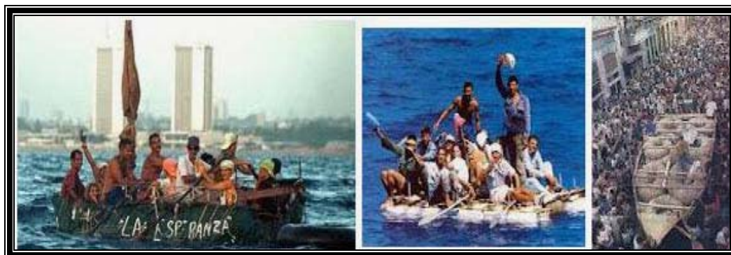
Crisis de los balseros de 1994

de sus alfiles y retira a sus guarda costas, de esta forma estalla en 1994 una nueva crisis, esta vez conocida como la “Crisis de los balseros”.