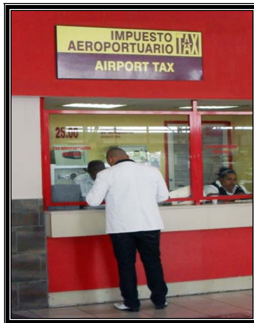
Pago de impuesto aeroportuarios.

Si en medio de las circunstancias actuales por las que atraviesa la familia cubana sus componentes emigrados tropiezan con estas restricciones aduanales, verán limitadas las posibilidades de ayudar a su familia con productos que en el mercado interno son ofertados con significativas sobre valoraciones, por tanto, para adquirirlos, habrá que devengar por ellos un elevado plus en una moneda que no es con la que se paga a un trabajador en Cuba, la política en este sentido es más que evidente que está enfocada a que se gaste lo que se reciba por concepto de ayuda familiar, en una red comercial interna, donde la calidad del producto y el servicio no se corresponden con los precios.