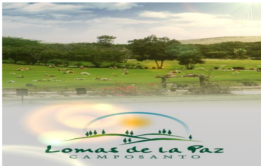
Vista panorámica del camposanto Lomas de la Paz, en Nuevo Chimbote