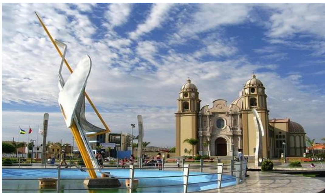
Pileta Principal d la Plaza Mayor de Nuevo Chimbote y al fondo la catedral