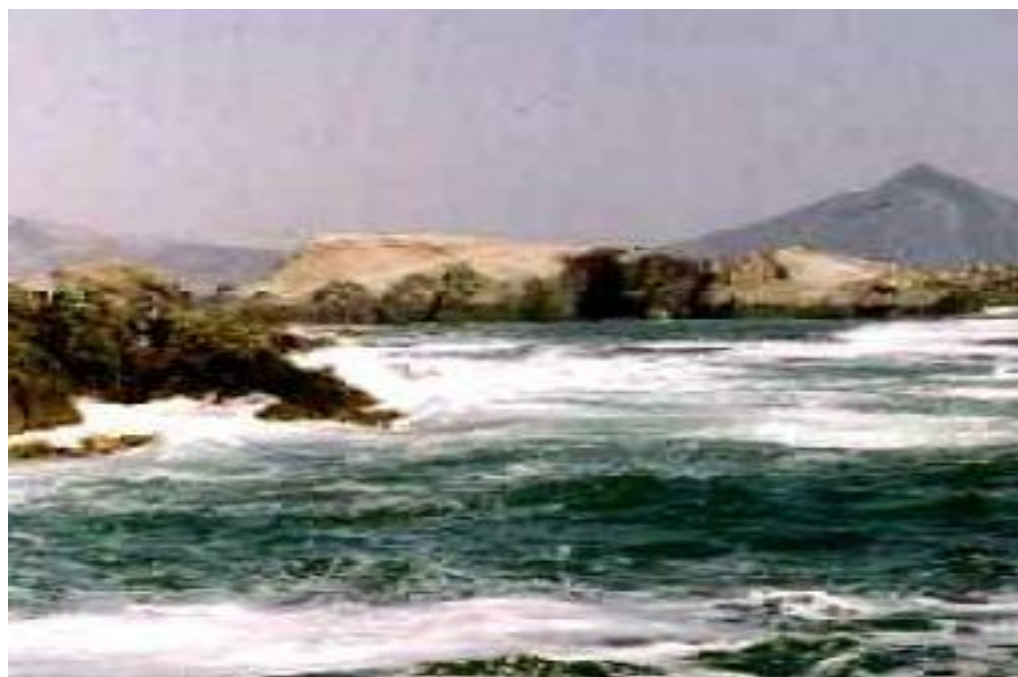
Las Playas... otros lugares turísticos