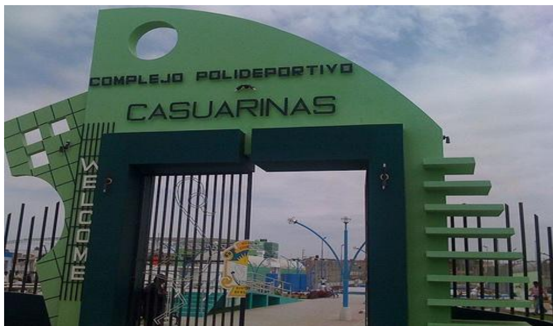
Puerta Principal del polideportivo de Casuarinas en Nuevo Chimbote