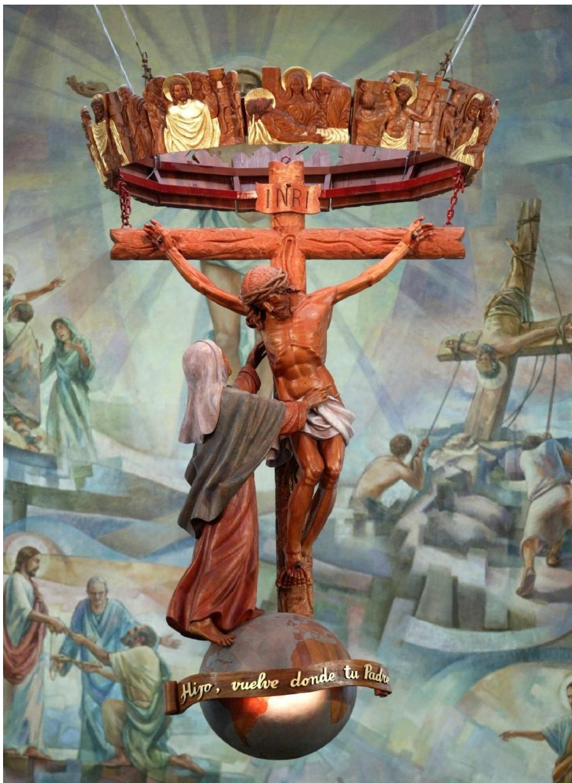
Artesanía Principal de al catedral de Nuevo Chimbote