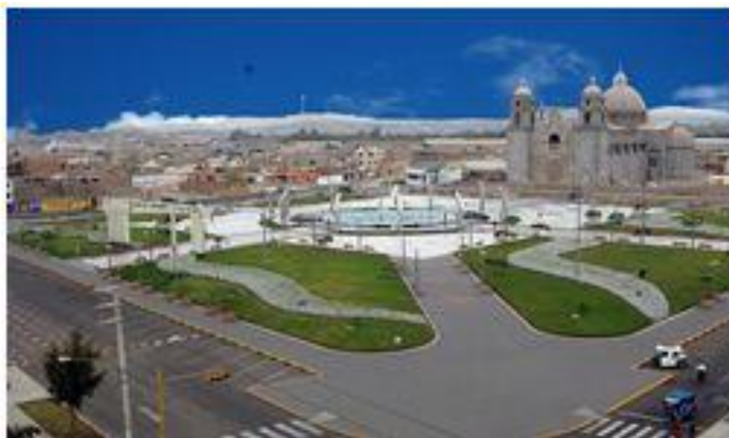
Vista panorámica de la Plaza mayor de Nuevo Chimbote