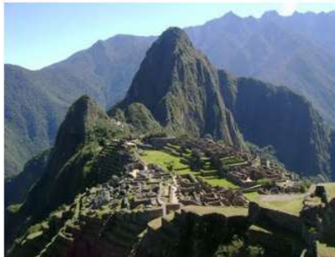
Fig. 1 Machupichu Perú.

El Perú, es un país ubicado en el sur del continente Americano, alberga en su seno una de las maravillas del mundo, como es la Fortaleza de Machu Picchu. Esta considerado dentro del bloque de los países tercermundistas por su situación económica y social. Desde el año 2006 viene siendo gobernado, por segunda vez, por el Partido Aprista Peruano encabezado por su líder el Dr. Alan García Pérez.