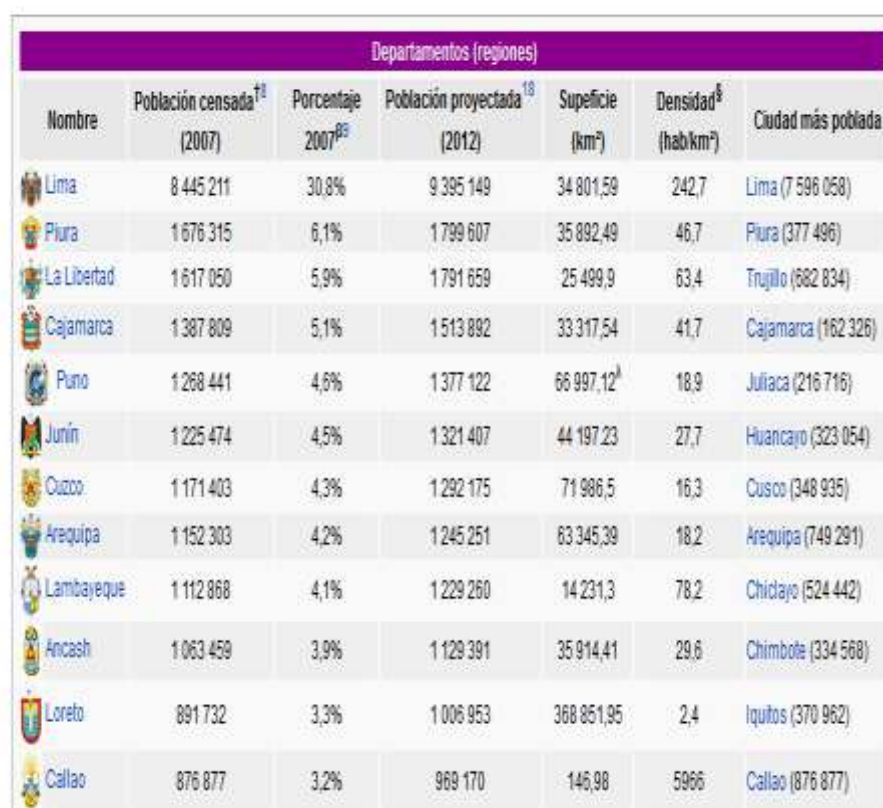
Fig. 3 Departamentos por población.

Artículo principal: Regiones y departamentos del Perú .