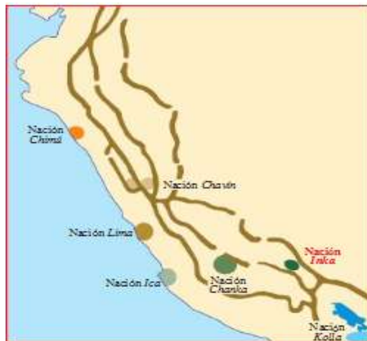
Fig. 2 Localización Geográfica de Lima.